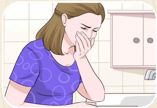
Тошнота и рвота