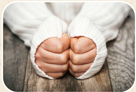
Холодные руки и ноги