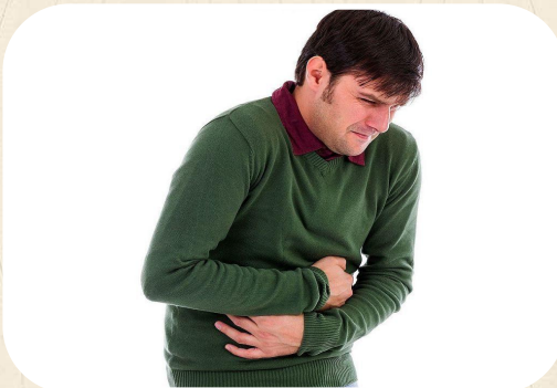
Боли в желудке