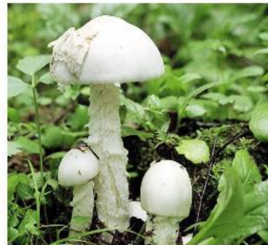
МУХОМОР БЕЛЫЙ ВОНЮЧИЙ