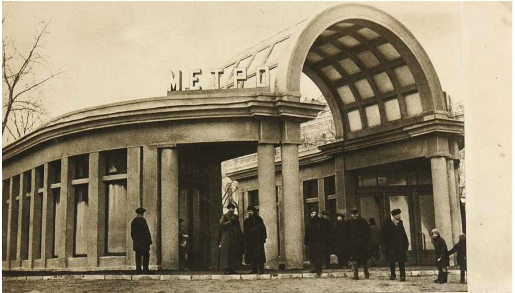
Москва. Станция метро „Кропоткинские ворота“