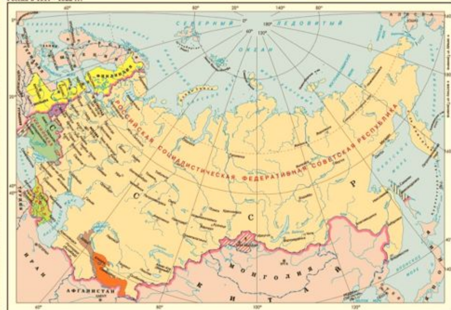
Россия в 1917 - 1922 гг.

окраину Российской империи территорию Прибалтики.