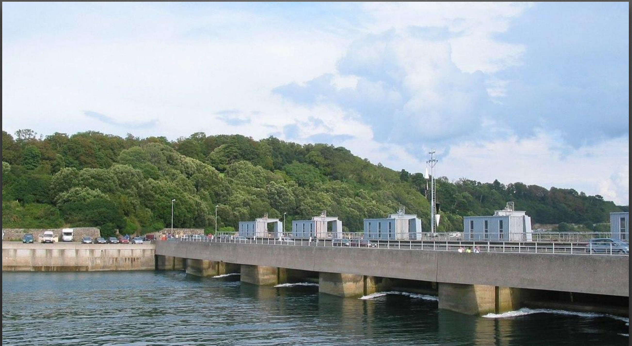
Приливные электростанции (ПЭС)