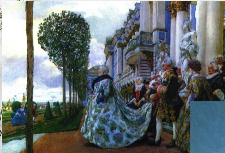
Императрица Елизавета Петровна в Царском Селе