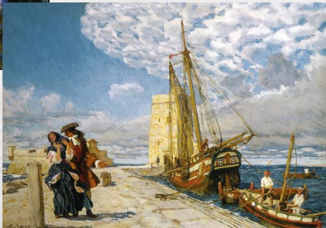
Прогулка на молу