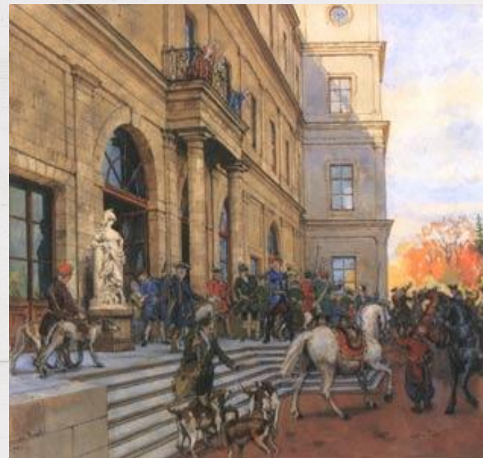
Выезд на охоту