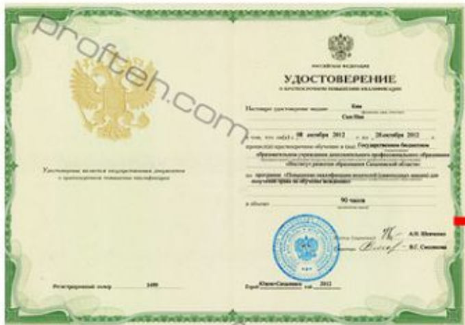
Удостоверение мастера производственного обучения вождению