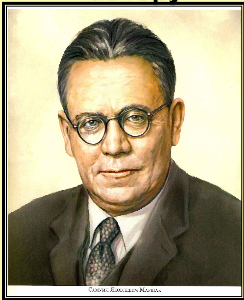
САМУИЛ ЯКОВЛЕВИЧ МАРШАК