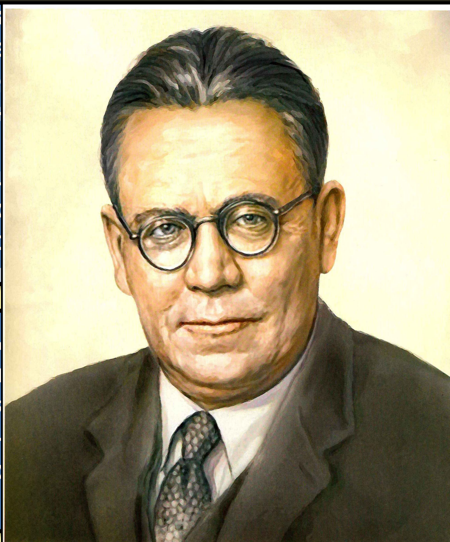
САМУИЛ ЯКОВЛЕВИЧ МАРШАК

Писать небольшие рассказы. Написал настоящие рассказы. Иностранцами. Как учился в одних. В 1923 году писатель юных зрителей