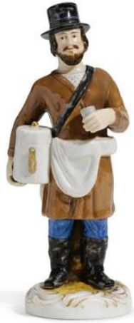
«Продавец сбитня». Завод Ф.Я. Гарднера, около 1840 года.

Estimate: £ 4,000 – 6,000 GBP ▼ LOT SOLD: 10,625 GBP (13,733 USD)