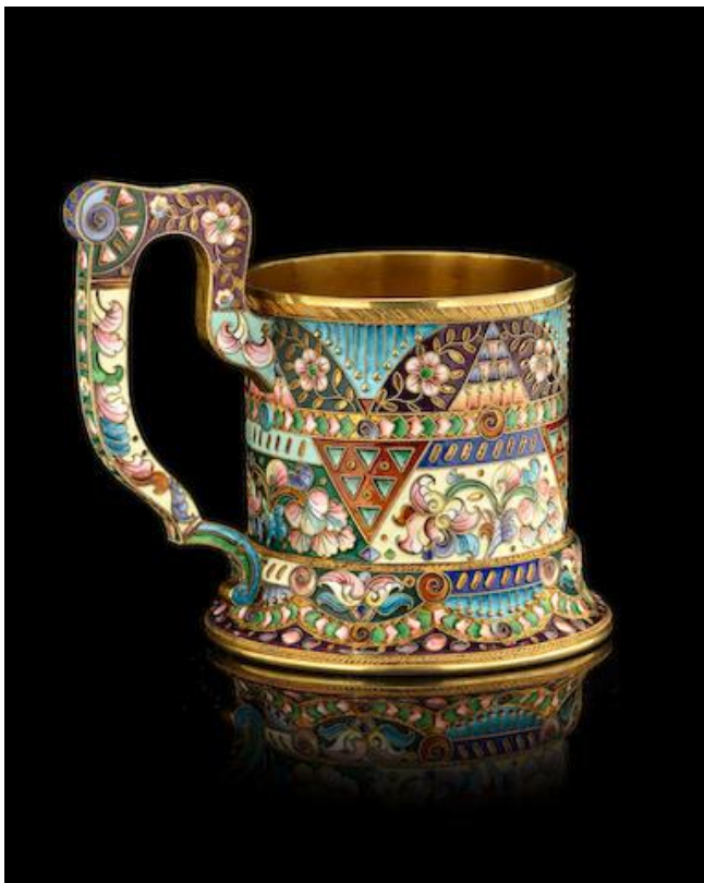
Подстаканник с эмалью. Москва, Шестая Московская Артель, 1908-1917-е гг.

Продан на июньских торгах аукциона Bonhams в 2017 году за £ 5 000 ( 427 730 рублей)