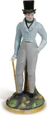
«Джентльмен» и «Леди». Завод Ф. Я. Гарднера, около 1820 года.

Продан на осенних торгах аукциона Sotheby's 2017 года за 4 750$ (285 000 рублей)