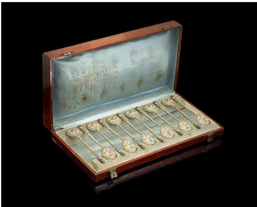
Серебряный набор из 12 ложек. Москва. Фабрика Густава Клингерта, 1899-1908 г.

Продан на июньских торгах аукциона Bonhams в 2017 году за £6,250 (534 663 рублей)