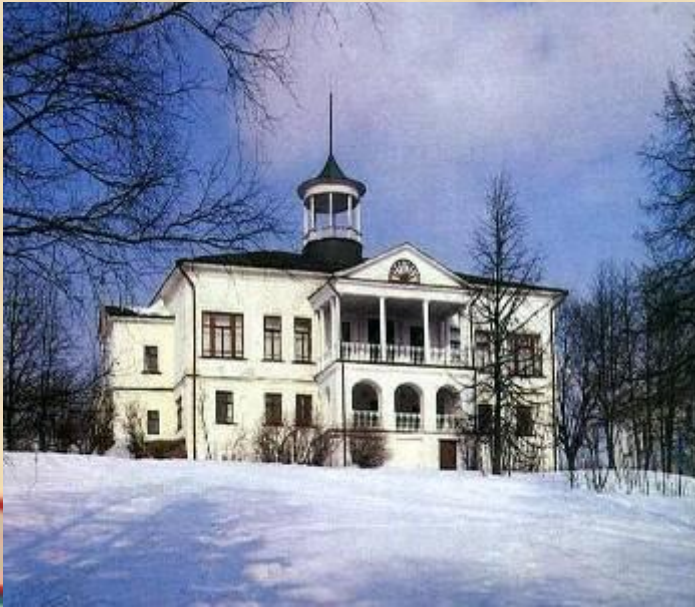
Дом-музей в Карабихе

Именно из Грешнёва Некрасов-поэт вынес исключительную чуткость к чужому страданию. В Грешнёве завязалась сердечная привязанность Некрасова к русскому крестьянину, определившая впоследствии исключительную народность его творчества.