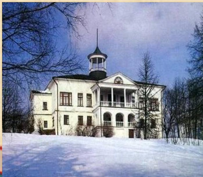
Дом-музей в Карабихе

Именно из Грешнёва Некрасов-поэт вынес исключительную чуткость к чужому страданию. В Грешнёве завязалась сердечная привязанность Некрасова к русскому крестьянину, определившая впоследствии исключительную народность его творчества.