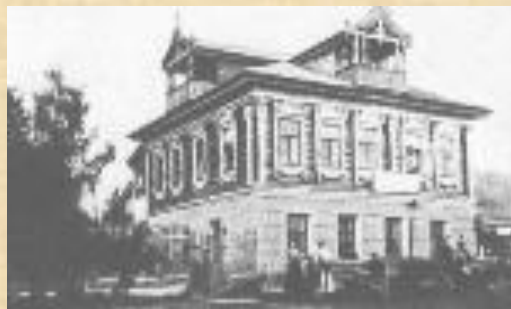
Дом-усадьба в Грешнёво