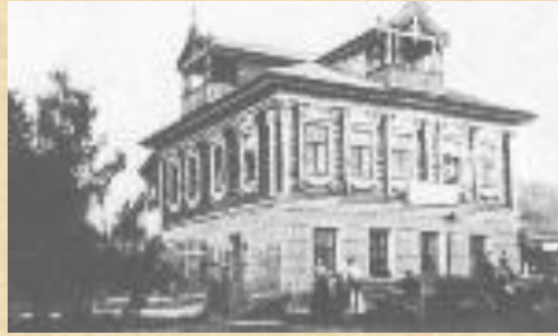
Дом-усадьба в Грешнёво