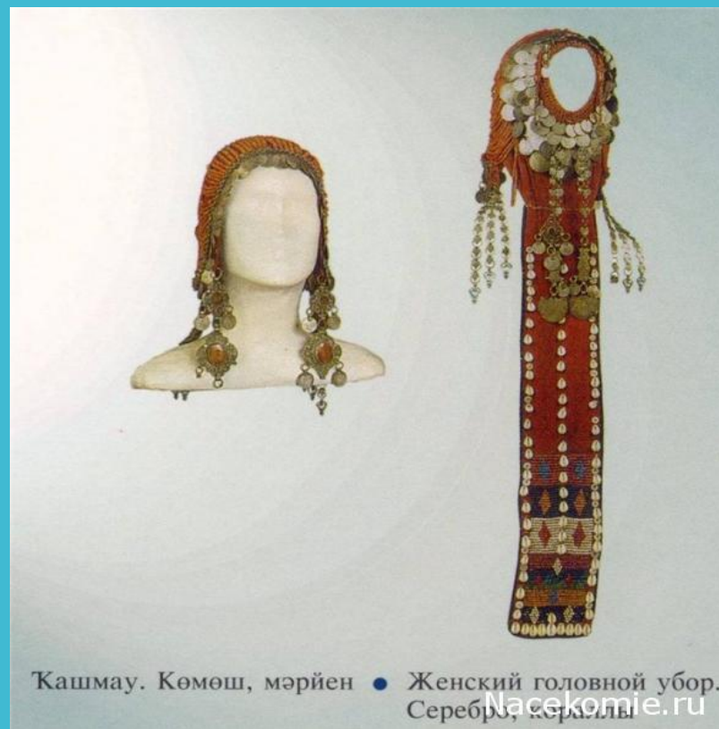
Кашмау. Көмөш, мәрйен ● Женский головной убор. Серебро, кораллы

Женские головные уборы отличались особым разнообразием и наиболее ярко отражали этнический колорит. В южных районах замужние женщины носили кашмау - шапочку с отверстием на макушке, украшенную кораллами, монетами и подвесками. На спину от кашмау спускалась длинная лента - койрок (в переводе "хвост"), расшитая бисером, с бахромой на конце. Только состоятельные семьи могли позволить себе такой шикарный головной убор.