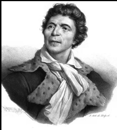
Макимилиан Робеспьер и Жан Поль Марат – лидеры якобинцев