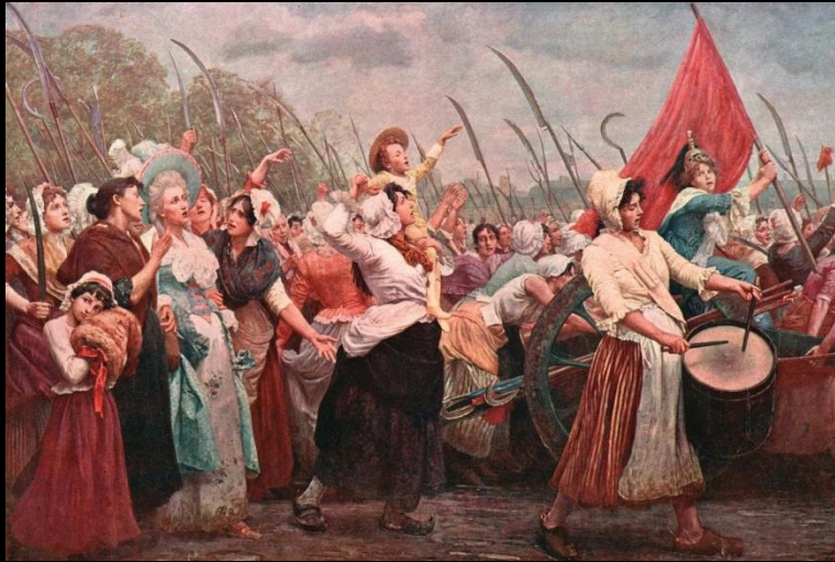
Поход на Версаль