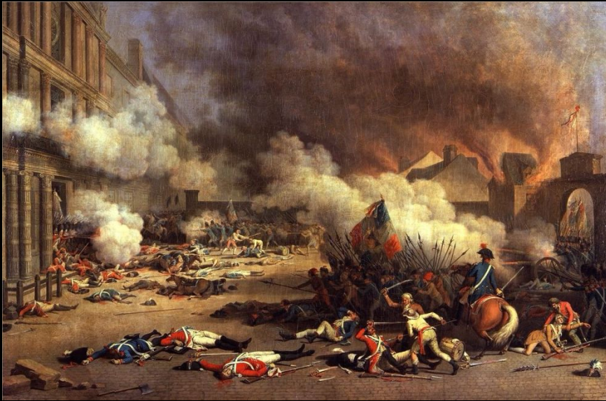
Штурм королевского дворца Тюильри