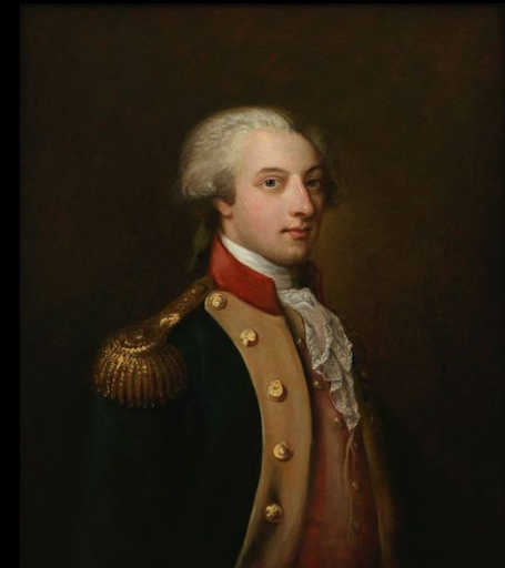
Маркиз де Лафайет