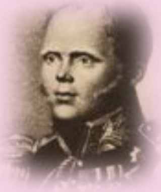
Константин Павлович отрекся от престола