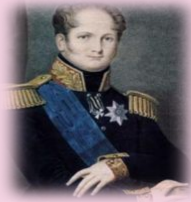
Александр I умер 19 ноября 1825 г. Детей не имел