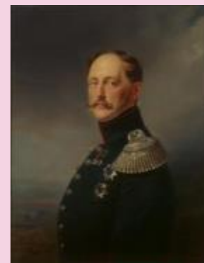
Николай I назначена переприсяга на 14 декабря 1825 г.