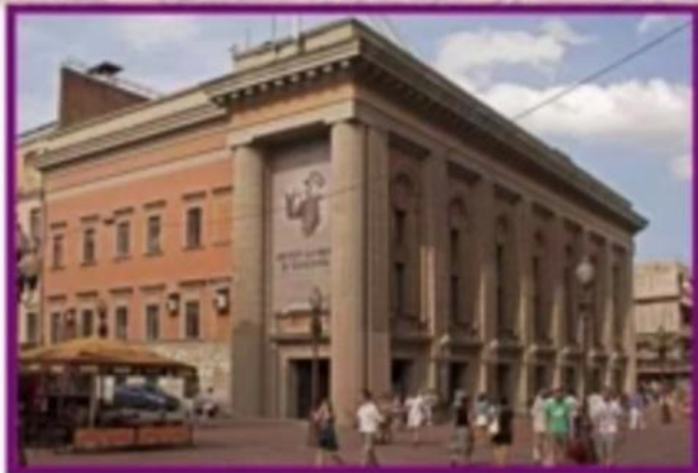
Государственный академический театр им. Е. Вахтангова