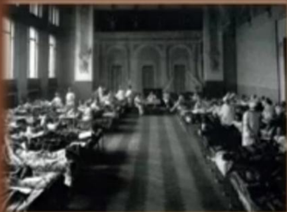
«Запискам юного врача» (1925-1926)