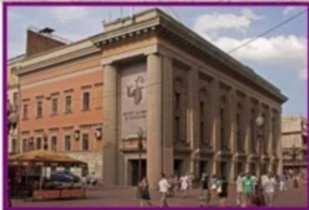
Государственный академический театр им. Е. Вахтангова