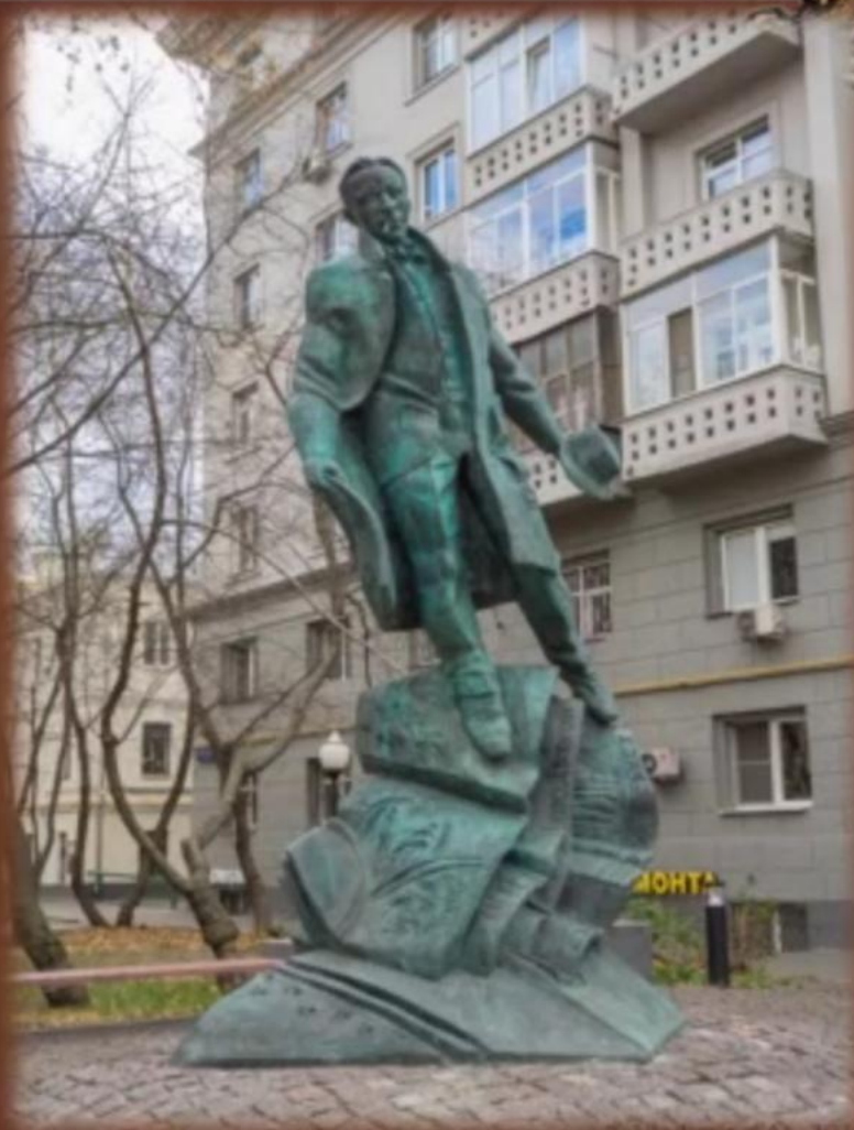
Памятник М.А. Булгакову в Москве