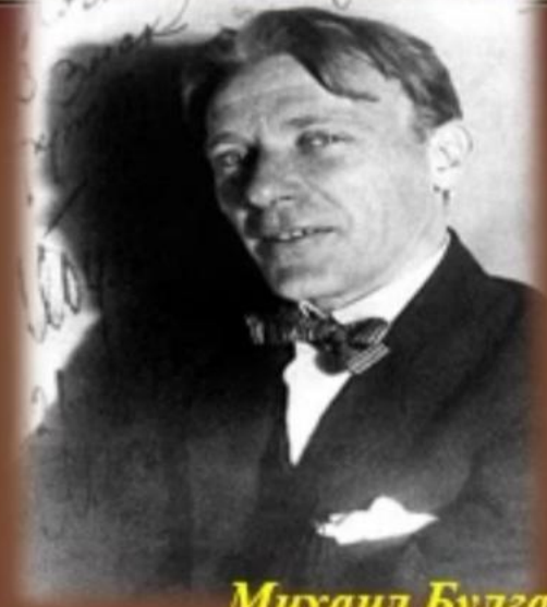
Михаил Булгаков в 1926 году

В конце сентября 1921 года М. А. Булгаков окончательно переехал в Москву и начал сотрудничать как фельетонист со столичными газетами («Гудок», «Рабочий») и журналами («Медицинский работник», «Россия», «Возрождение», «Красный журнал для всех»). В это же время он опубликовал некоторые свои произведения в газете «Накануне», выпускавшейся в Берлине. С 1922 по 1926 год в газете «Гудок» было напечатано более 120 репортажей, очерков и фельетонов М. Булгакова. В 1923 году Булгаков вступил во Всероссийский Союз писателей.