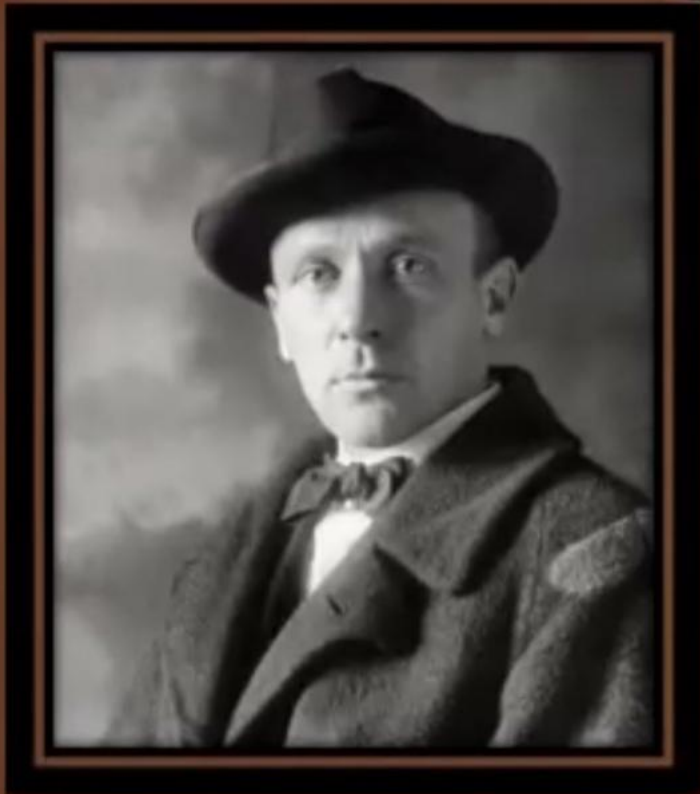
Михаил Афанасьевич Булгаков 15 мая 1891 – 10 марта 1940)

✓ русский писатель, драматург, театральный режиссёр и актёр. Автор повестей и рассказов, множества фельетонов, пьес, инсценировок, киносценариев, оперных либретто;