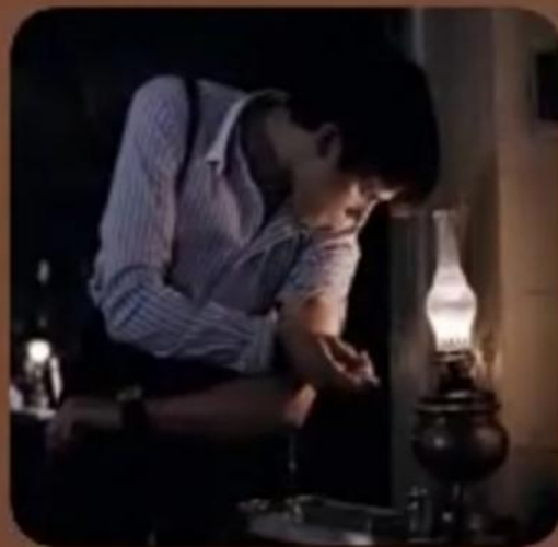
Отрывок из к/ф «Морфий» 2008