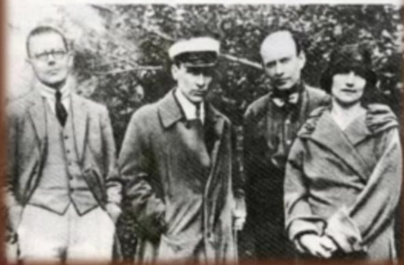
М. Булгаков и Л. Е. Белозерская (вторая жена писателя) с друзьями 1928 г.

Любовь Евгеньевна Белозёрская (1895- 1987) стала впоследствии автором книги о жизни с Булгаковым «О, мёд воспоминаний»