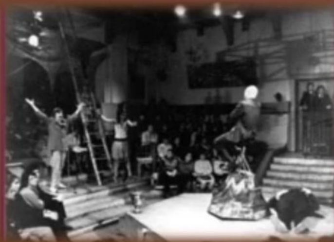
Сцена из спектакля «Зойкина квартира»

В 1926 году в Театре им. Вахтангова с большим успехом прошла премьера спектакля по пьесе «Зойкина квартира». В 1928 году М. Булгаков ездил с женой на Кавказ, посетил Тифлис, Батуми, Зелёный Мыс, Владикавказ, Гудермес.