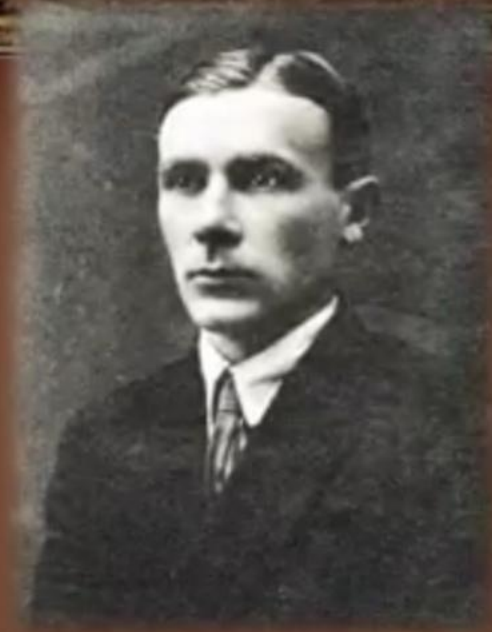
Михаил Булгаков в 1920-х годах

С 1919 года Михаил Афанасьевич стал печататься в газетах с подписью М.Б. Во время отступления Добровольческой армии в начале 1920 года был болен тифом и поэтому вынужденно не покинул страну. К 1920-м годам Булгаков дошёл до крайности, принимая морфий по пять раз в день в немыслимых дозах.