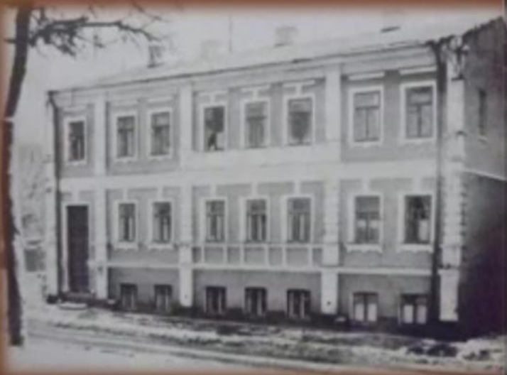
Дом на Воздвиженской №10 в Киеве, где родился Булгаков