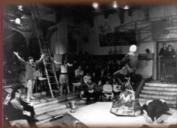
Сцена из спектакля «Зойкина квартира»

В 1926 году в Театре им. Вахтангова с большим успехом прошла премьера спектакля по пьесе «Зойкина квартира». В 1928 году М. Булгаков ездил с женой на Кавказ, посетил Тифлис, Батуми, Зелёный Мыс, Владикавказ, Гудермес.