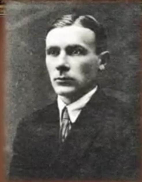
Михаил Булгаков в 1920-х годах

С 1919 года Михаил Афанасьевич стал печататься в газетах с подписью М.Б. Во время отступления Добровольческой армии в начале 1920 года был болен тифом и поэтому вынужденно не покинул страну. К 1920-м годам Булгаков дошёл до крайности, принимая морфий по пять раз в день в немыслимых дозах.