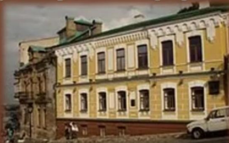
Дом в Киеве, в котором в 1906—1922 гг. жил Булгаков

В 1901 году Михаила Булгакова зачислили в самую престижную школу города — Первую Киевскую мужскую гимназию, где были сосредоточены лучшие преподаватели Киева. Учеба давалась ему легко: первый, второй, третий и шестой классы будущий писатель закончил с наградами. Уже в гимназии Булгаков проявлял свои незаурядные способности: писал стихи, рисовал карикатуры, играл на рояле, пел, сочинял устные рассказы и прекрасно их рассказывал.