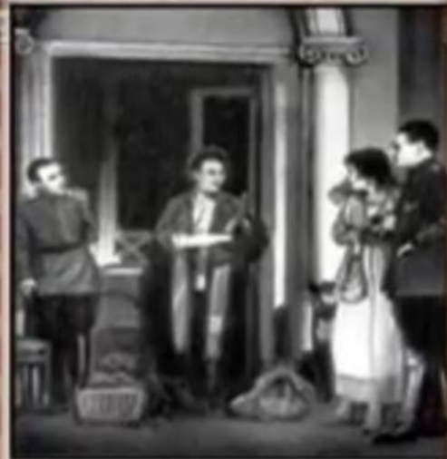
МХАТ. Сцены из спектакля "Дни Турбиных" М. А. Булгакова. 1926.

Однако, в своих выступлениях И. Сталин говорил: «Дни Турбиных» - «антисоветская штука, и Булгаков не наш».