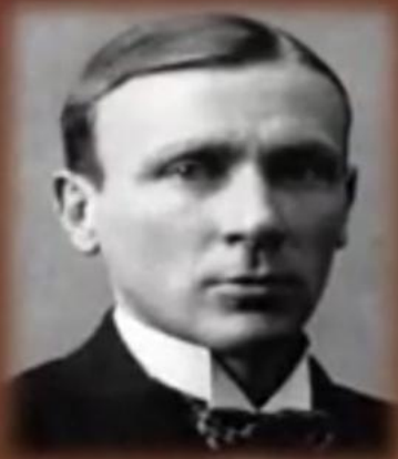
Михаил Булгаков в 1917 году