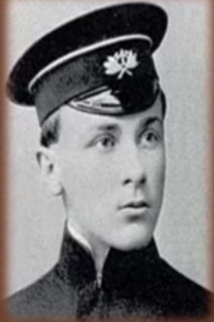
Булгаков в 1909 году. Выпускник Первой киевской гимназии

В 1901 году Михаила Булгакова зачислили в самую престижную школу города — Первую Киевскую мужскую гимназию, где были сосредоточены лучшие преподаватели Киева. Учеба давалась ему легко: первый, второй, третий и шестой классы будущий писатель закончил с наградами. Уже в гимназии Булгаков проявлял свои незаурядные способности: писал стихи, рисовал карикатуры, играл на рояле, пел, сочинял устные рассказы и прекрасно их рассказывал.