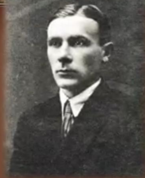
Михаил Булгаков в 1920-х годах

С 1919 года Михаил Афанасьевич стал печататься в газетах с подписью М.Б. Во время отступления Добровольческой армии в начале 1920 года был болен тифом и поэтому вынужденно не покинул страну. К 1920-м годам Булгаков дошёл до крайности, принимая морфий по пять раз в день в немыслимых дозах.