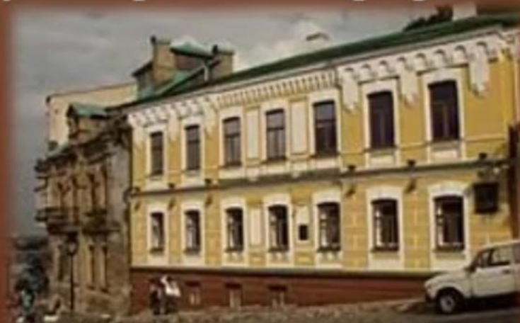
Дом в Киеве, в котором в 1906—1922 гг. жил Булгаков

В 1901 году Михаила Булгакова зачислили в самую престижную школу города — Первую Киевскую мужскую гимназию, где были сосредоточены лучшие преподаватели Киева. Учеба давалась ему легко: первый, второй, третий и шестой классы будущий писатель закончил с наградами. Уже в гимназии Булгаков проявлял свои незаурядные способности: писал стихи, рисовал карикатуры, играл на рояле, пел, сочинял устные рассказы и прекрасно их рассказывал.