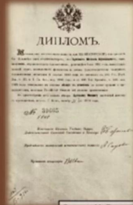
Диплом М. Булгакова