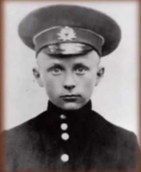
Булгаков в детстве