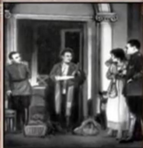
МХАТ. Сцены из спектакля "Дни Турбиных" М. А. Булгакова. 1926.

Однако, в своих выступлениях И. Сталин говорил: «Дни Турбиных» - «антисоветская штука, и Булгаков не наш».