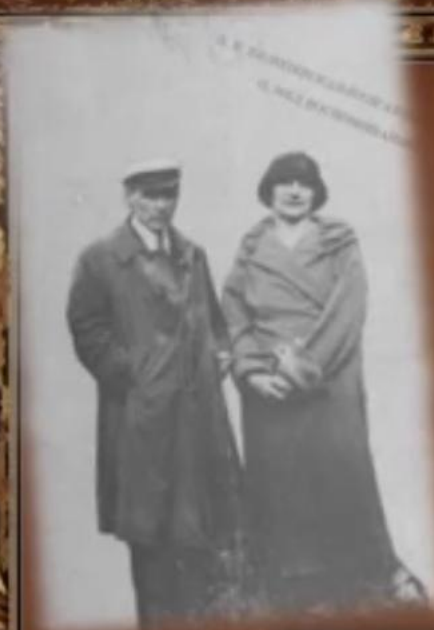
Л.Е. БЕЛОЗЕРСКАЯ- БУЛГАКОВА Воспоминания