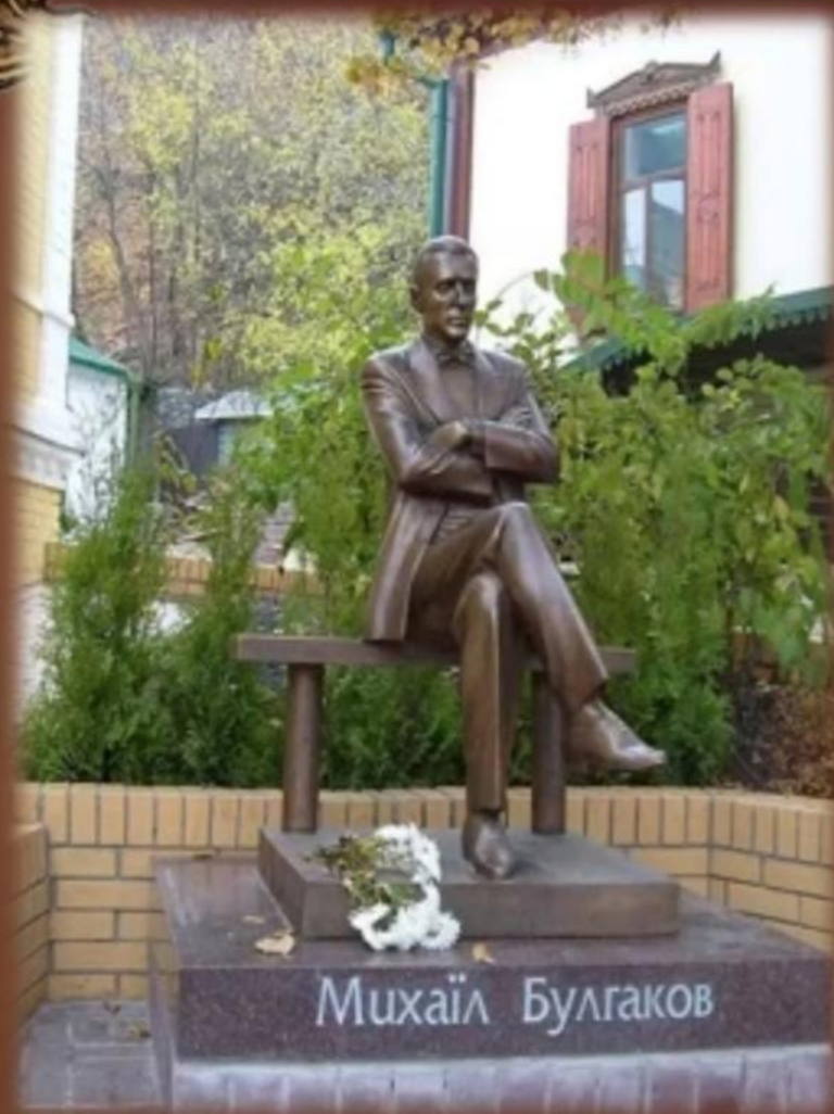
Памятник Булгакову в Києве