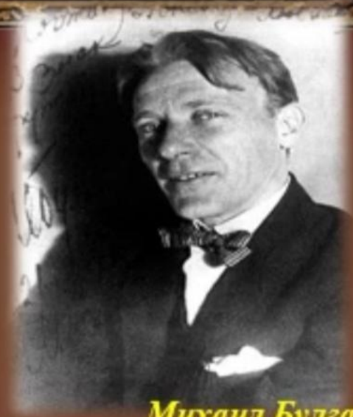
Михаил Булгаков в 1926 году

В конце сентября 1921 года М. А. Булгаков окончательно переехал в Москву и начал сотрудничать как фельетонист со столичными газетами («Гудок», «Рабочий») и журналами («Медицинский работник», «Россия», «Возрождение», «Красный журнал для всех»). В это же время он опубликовал некоторые свои произведения в газете «Накануне», выпускавшейся в Берлине. С 1922 по 1926 год в газете «Гудок» было напечатано более 120 репортажей, очерков и фельетонов М. Булгакова. В 1923 году Булгаков вступил во Всероссийский Союз писателей.