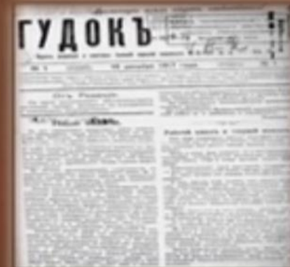
Первый номер газеты «Гудок»