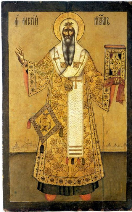
Митрополит Алексий. Икона XVII в.

В 1359 г. после кончины Ивана Ивановича Красного по традиции наследником должен был стать его старший сын – Дмитрий Иванович, который вошел в историю как Дмитрий Донской (1359 – 1389 гг.)