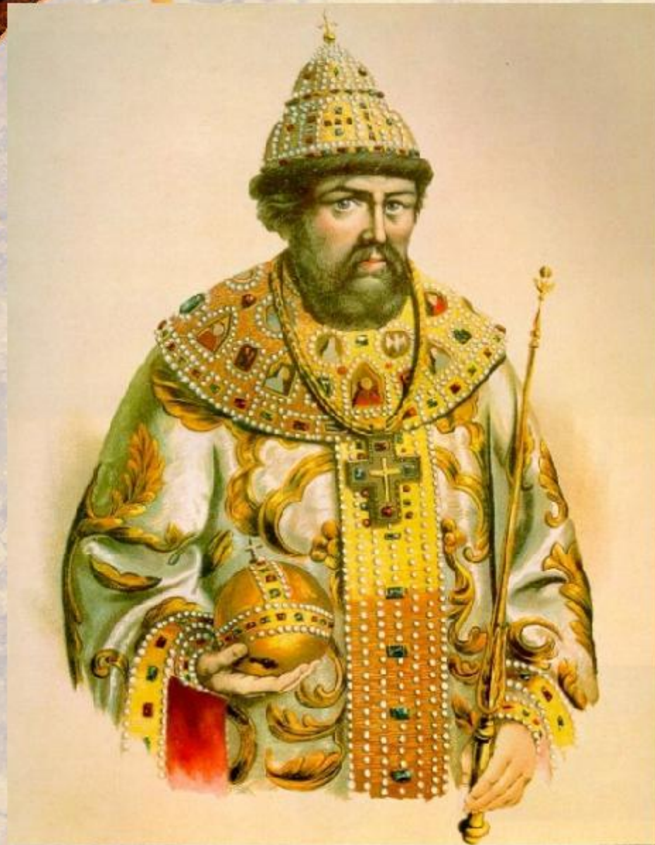
Иван Калита 1325 – 1340 гг.