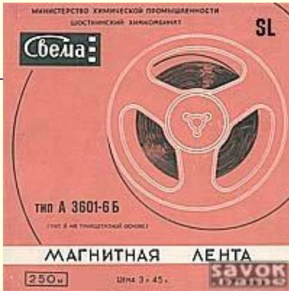
Катушка 250м магнитной ленты "Тип-6" на триацетатной основе. 1973 г.