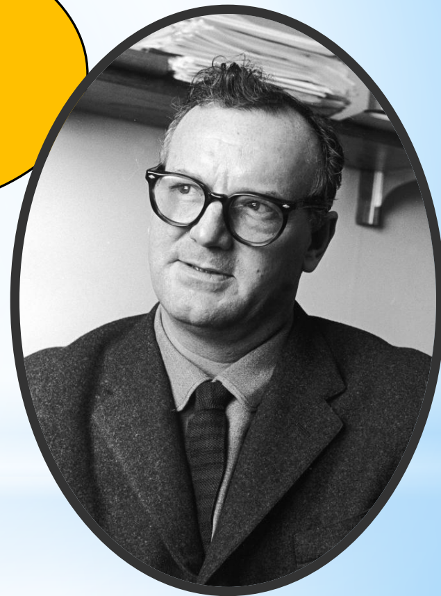
Чарльз Райт Миллс