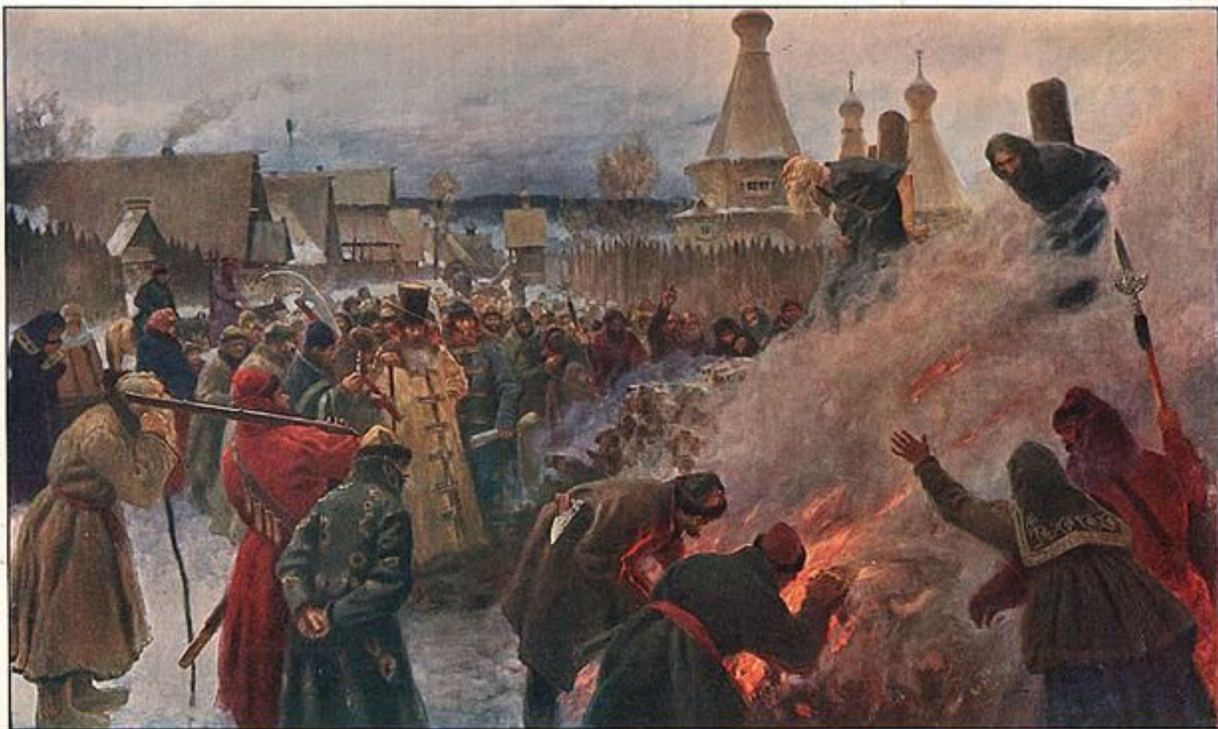
П. Мясоедовъ. Сожжение протопопа Аввакума. Музей Императорской Академіи Художествъ.