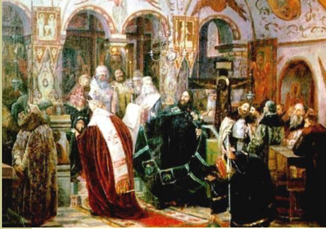
Лишение Никона на Соборе Патриаршего сана. Неизвестный художник. (19 век).