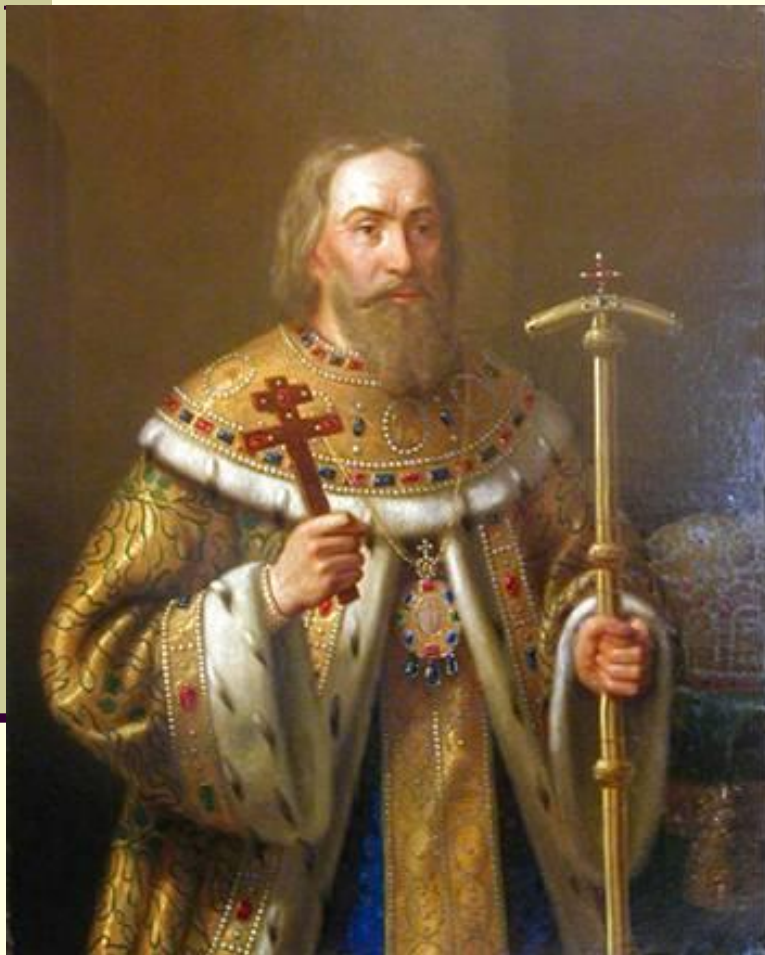
Н. Тютрюмов. Портрет патриарха Филарета.

Церковь, как и остальное население, разделилось на две части: