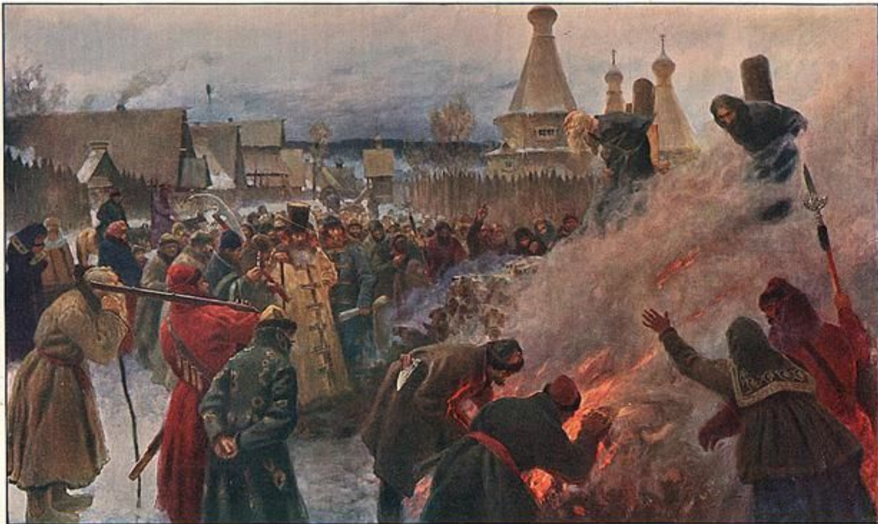
П. Мясоедовъ. Сожжение протопопа Аввакума. Музей Императорской Академіи Художествъ.