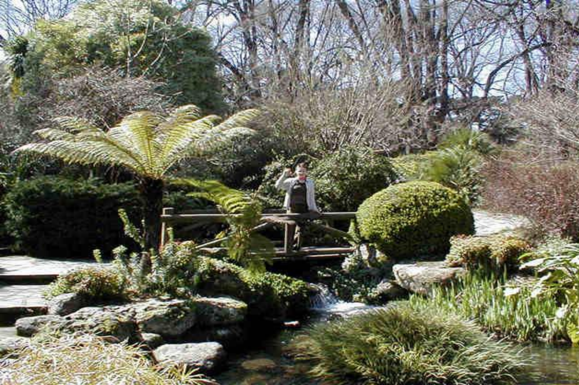
Жестколистные леса средиземноморского типа