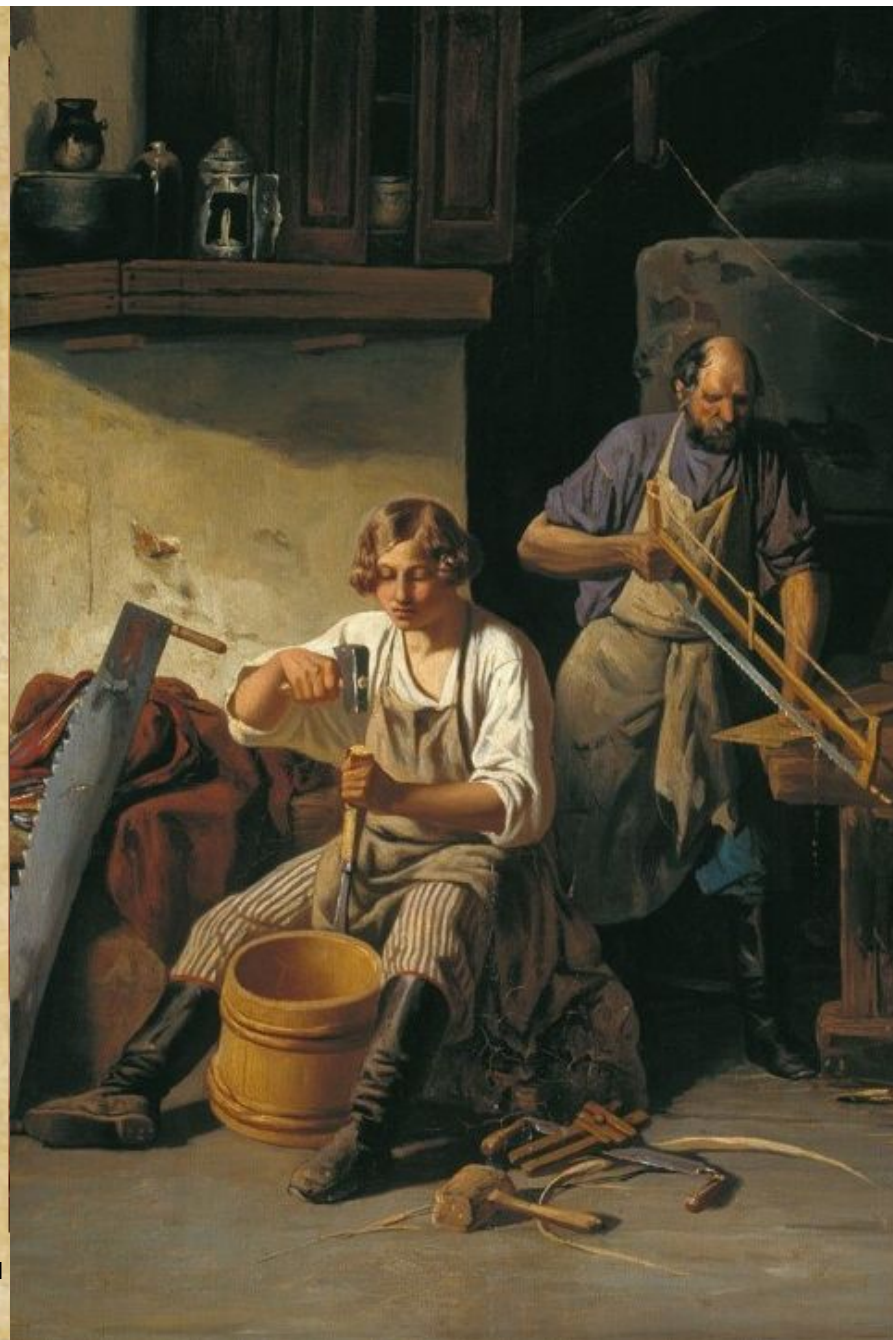
Лавр Кузьмич Плахов "В бондарной мастерской". Середина 1840-х. Холст, масло 65x54,2 см. Национальный художественный музей Республики Беларусь, Минск.