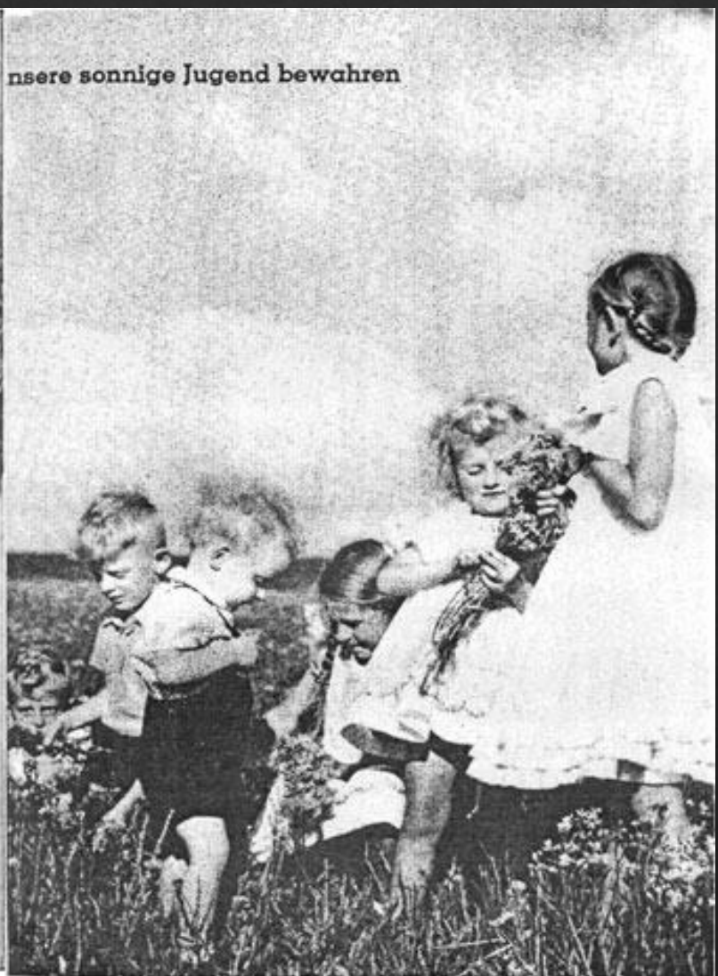
unsere sonnige Jugend bewahren