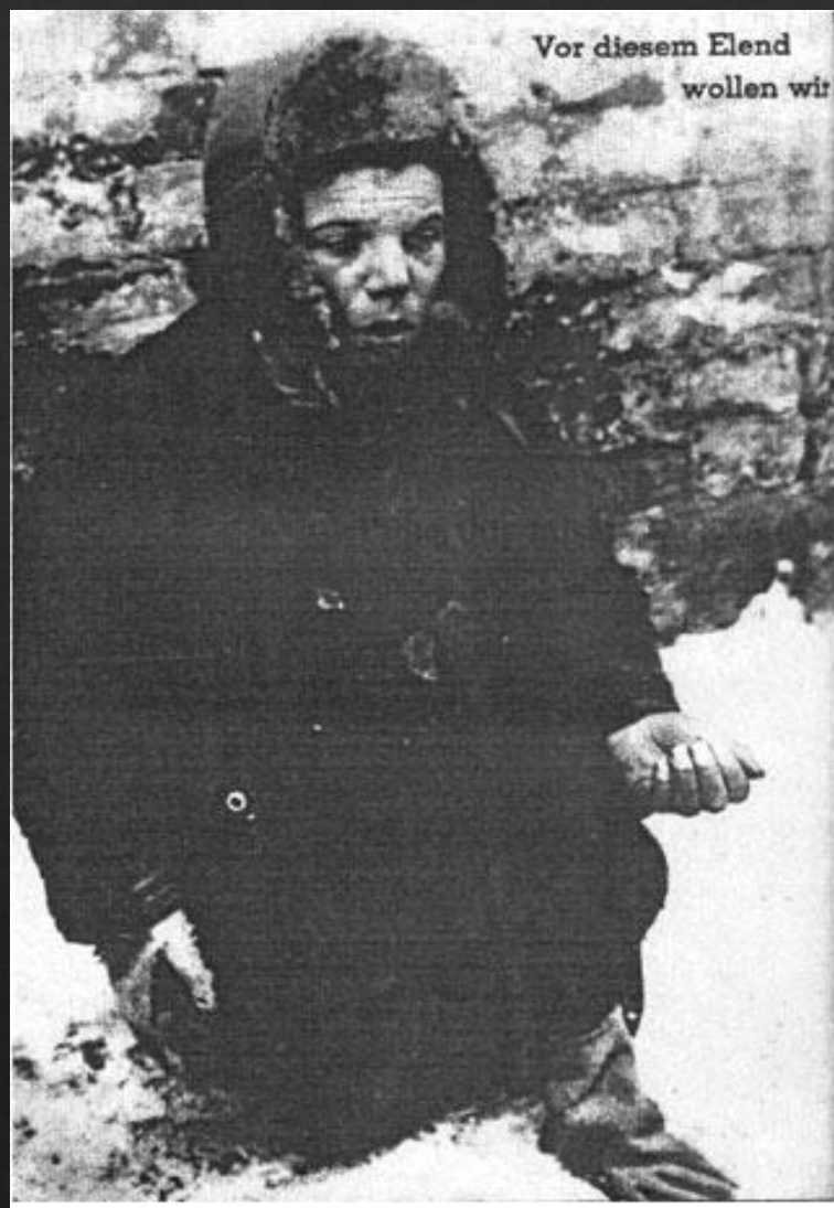
Vor diesem Elend wollen wir