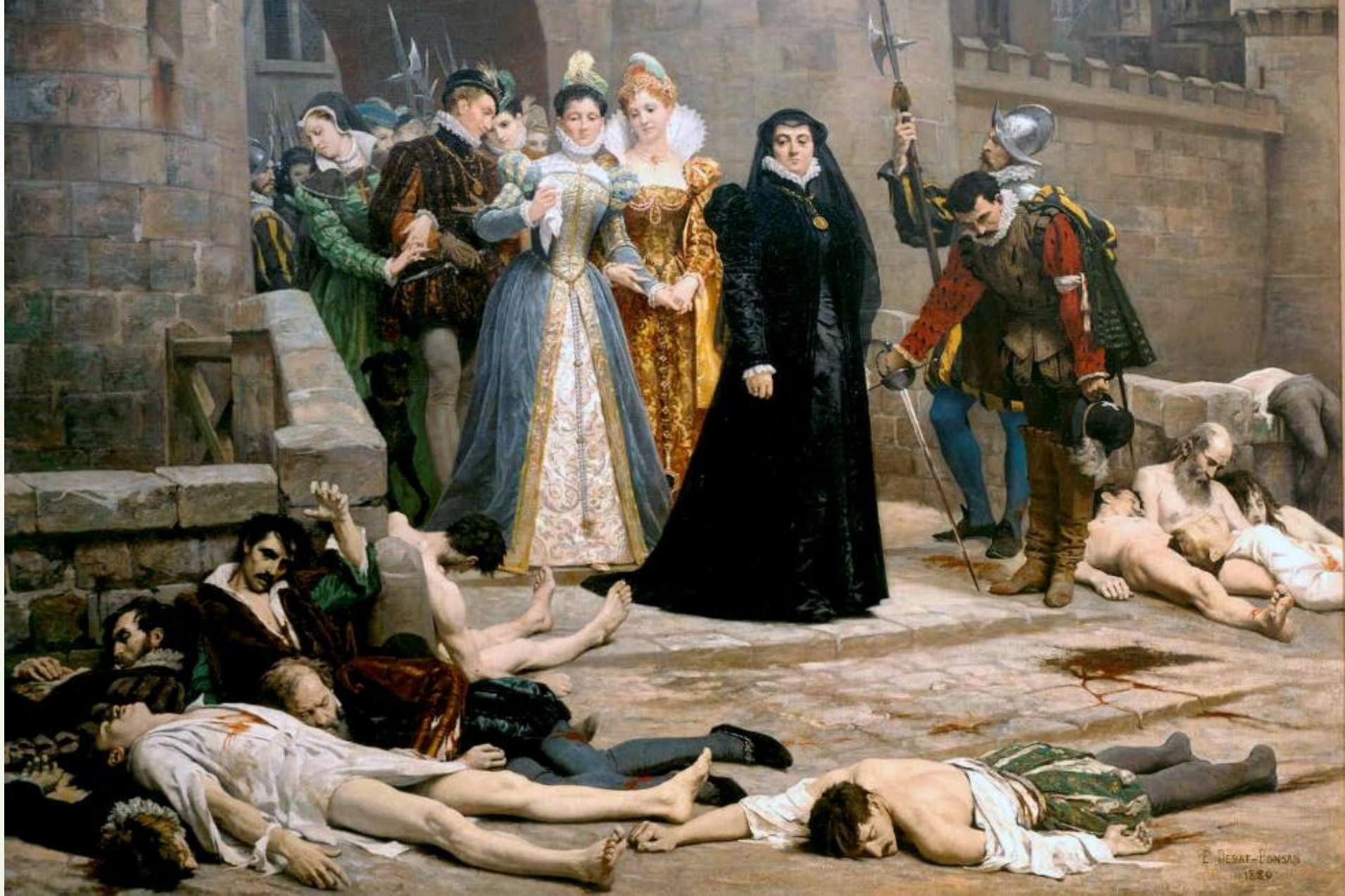
Варфоломеевская ночь во Франции – 1572 г.