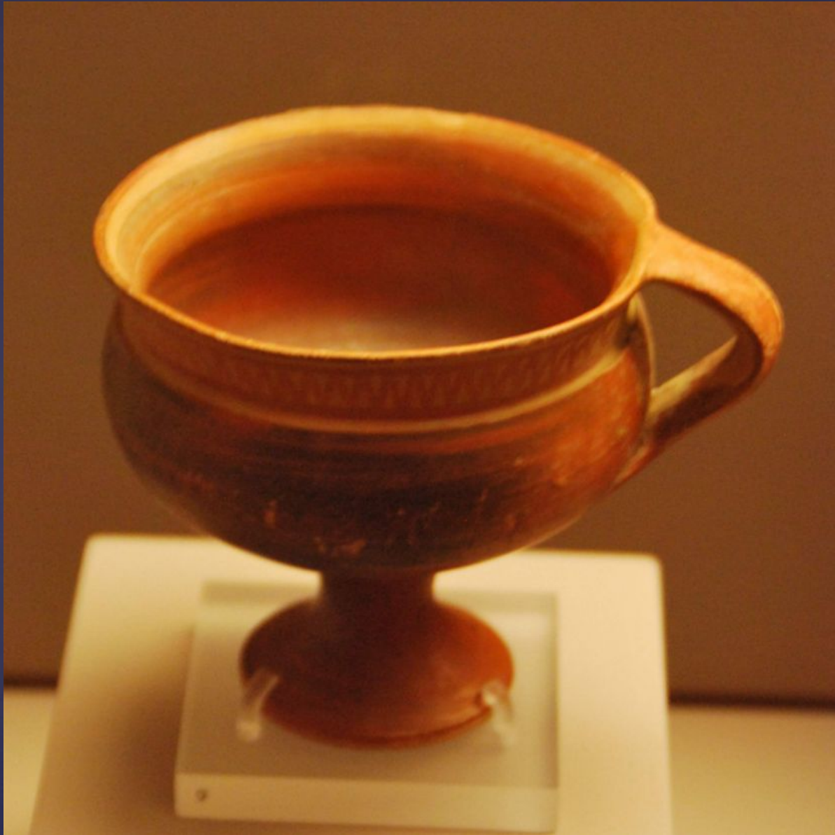
Чаша; X век до н. э. (поздний Protogeometric); Н. П. Гуландрис Сб. 401 в Музее Кикладского искусства в Афинах.