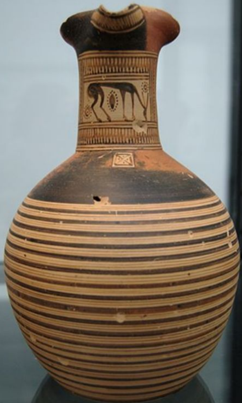
Амфора, на шее: пасутся козули, Dipylos Мастер стиля. Аттика, ок. 750 году до нашей эры. Государственное Античное Собрание Местоположение Мюнхен