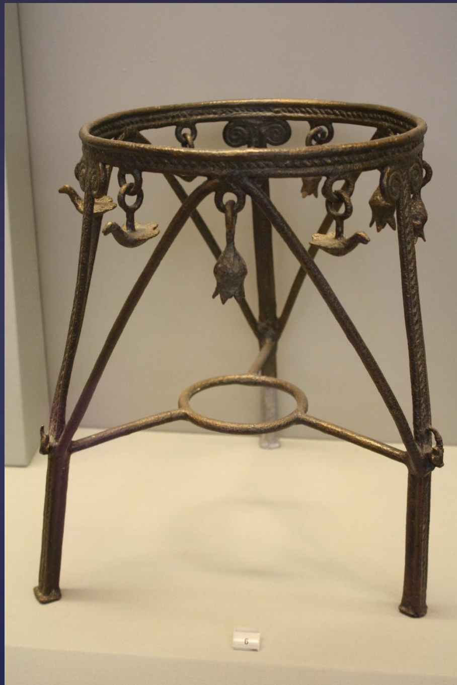
Треножник из Тиринфа. Бронза X-IX вв. до н.э.