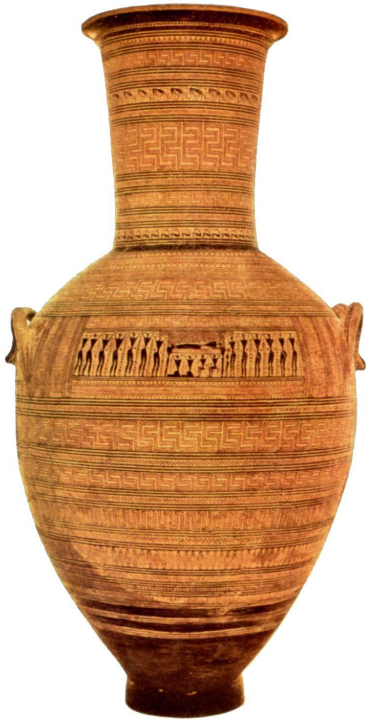
Амфора из Керамика, т.н. Дипилонская амфора. Протесис. Середина VIII в. до н.э.