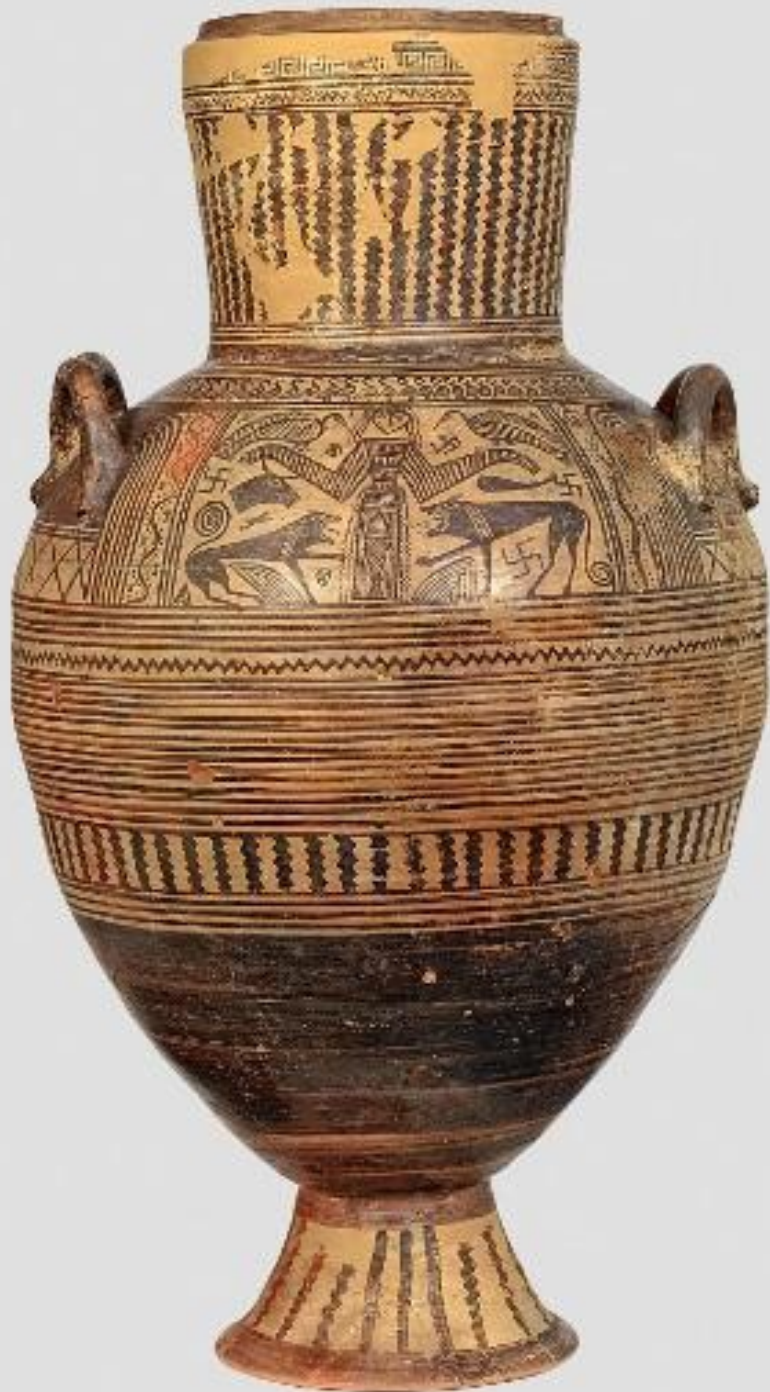
Амфора из Фив. Владычица. Ок. 680 г. до н.э.