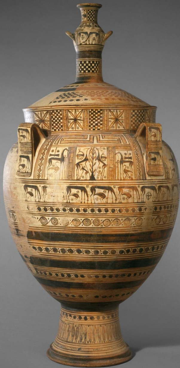
Кратер из Куриона. Олени (?) у мирового древа. Начало VII в. до н.э