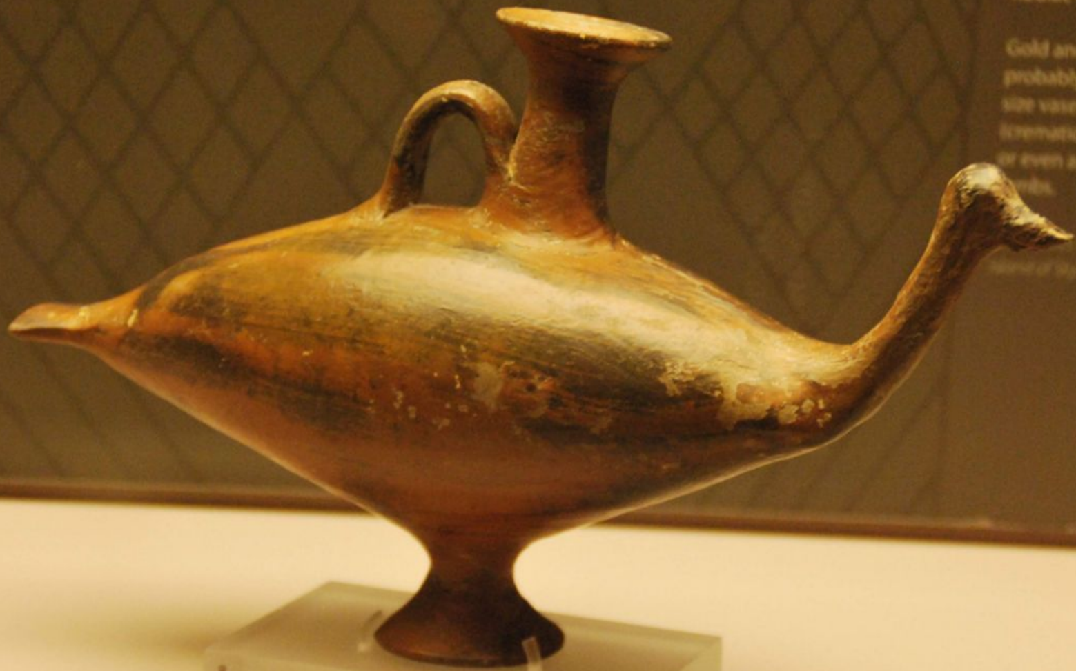
Ваза X век до н. э. (поздний Protogeometric); Н. П Гуландрис Сб. 382 в Музее Кикладского искусства в Афинах.