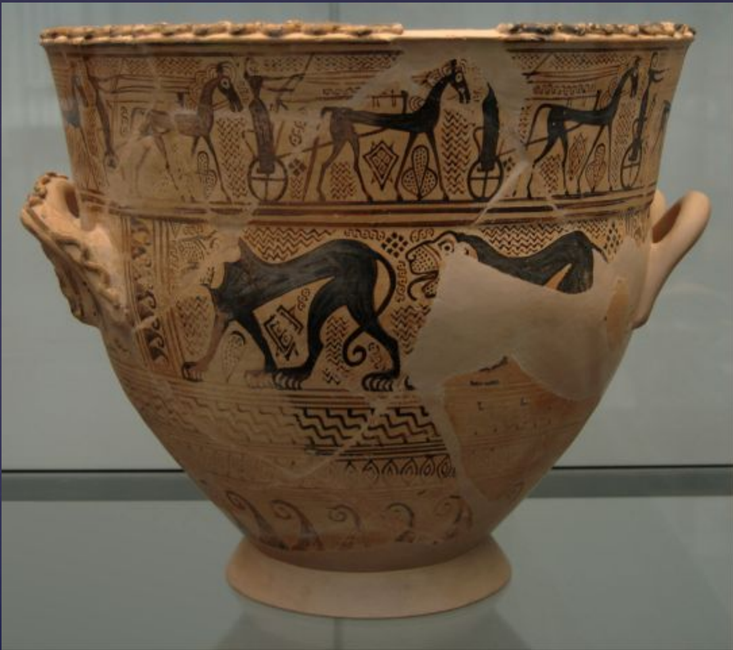
Кратер, Анаталосский мастер. около 690 г. до н. э. Место создания: Атика. Государственное Античное Собрание, Мюнхен.