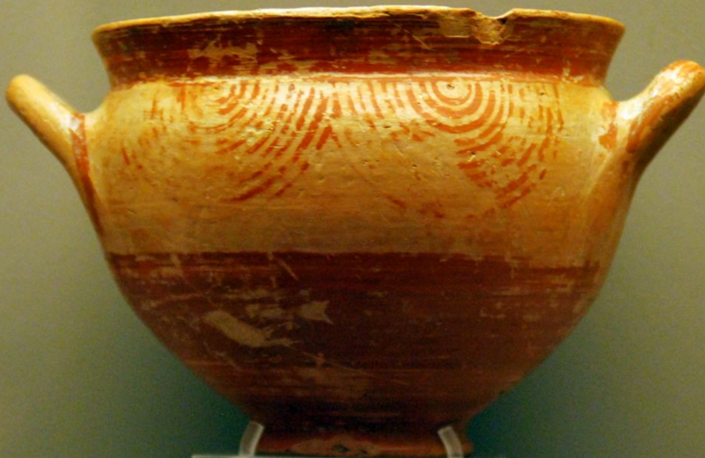
Скифос; X-IX века до н. э. (поздний Protogeometric); Н. П Гуландрис Сб. 430 в Музее Кикладского искусства в Афинах.