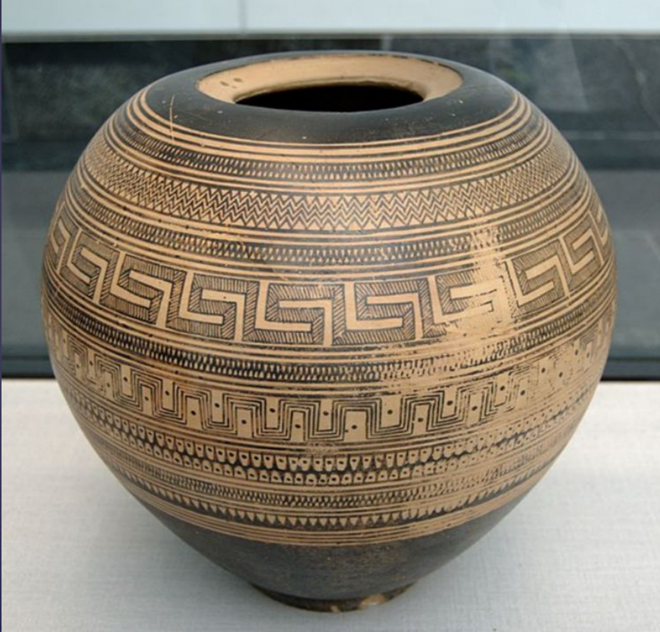
Пиксида. Аттика, ок. 850 году до нашей эры. Государственное Античное Собрание. Местоположение: Мюнхен