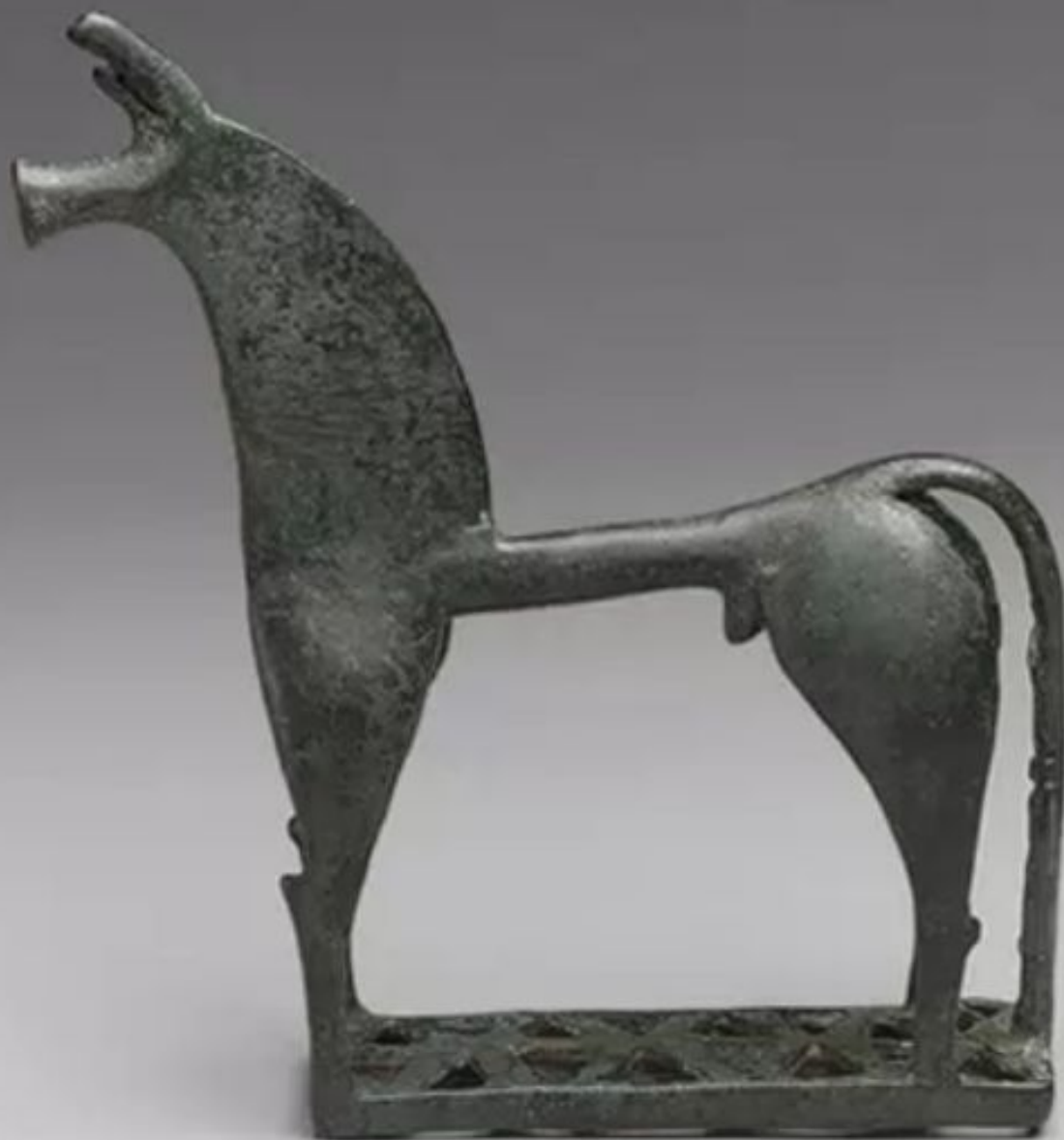
Конь, Бронза. Афины. VIII век до н. э.