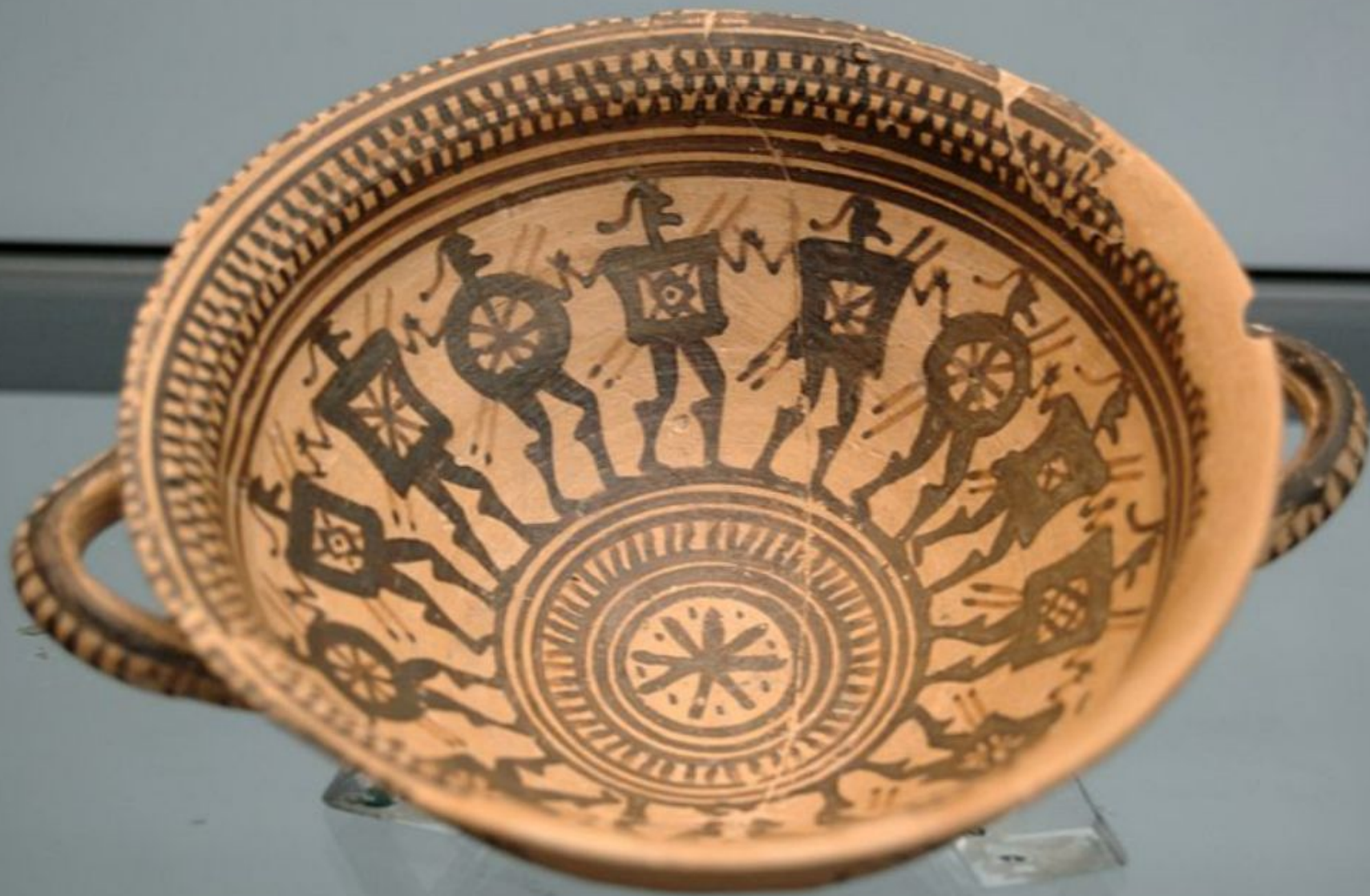
Фриз танцы воинов, каждый из которых несет свой щит и два копья. Килик, VIII века до н.э. Место расположения: Государственный Государственное Античное Собрание, Мюнхен