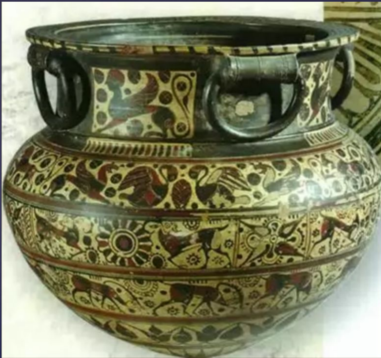
Динос с кольцевидными ручками из Этрурии. Фризы животных и сцены терзаний. Ок. 600 г. до н.э.