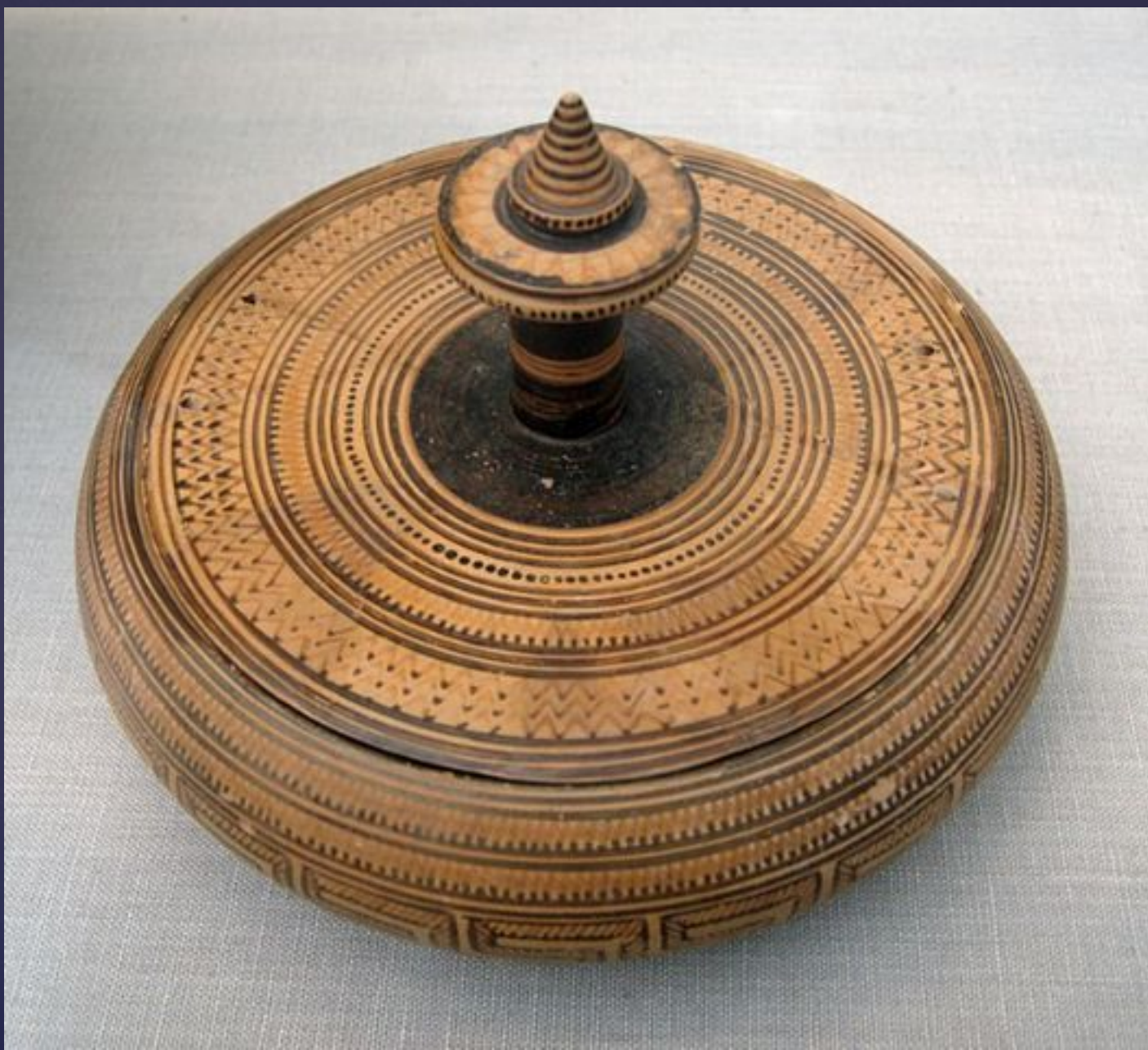
Пиксида. Геометрический стиль, 1000-700 до н. э. Государственное Античное Собрание. Местоположение: Мюнхен.