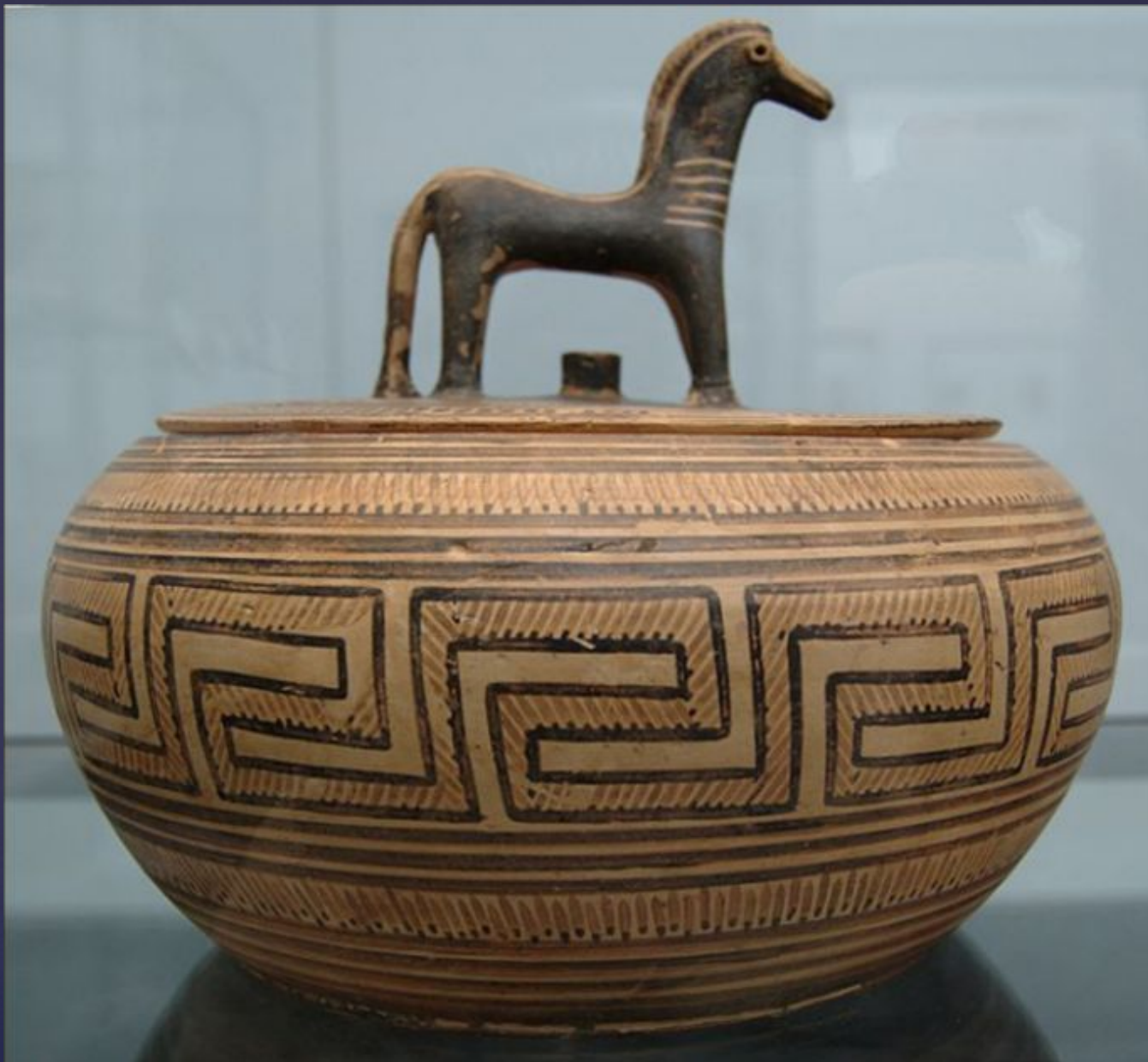
Пиксида с лошадьёу в качестве ручки крышки. Аттика, ок. 570 до н. э. Государственное Античное Собрание. Местоположение: Мюнхен.