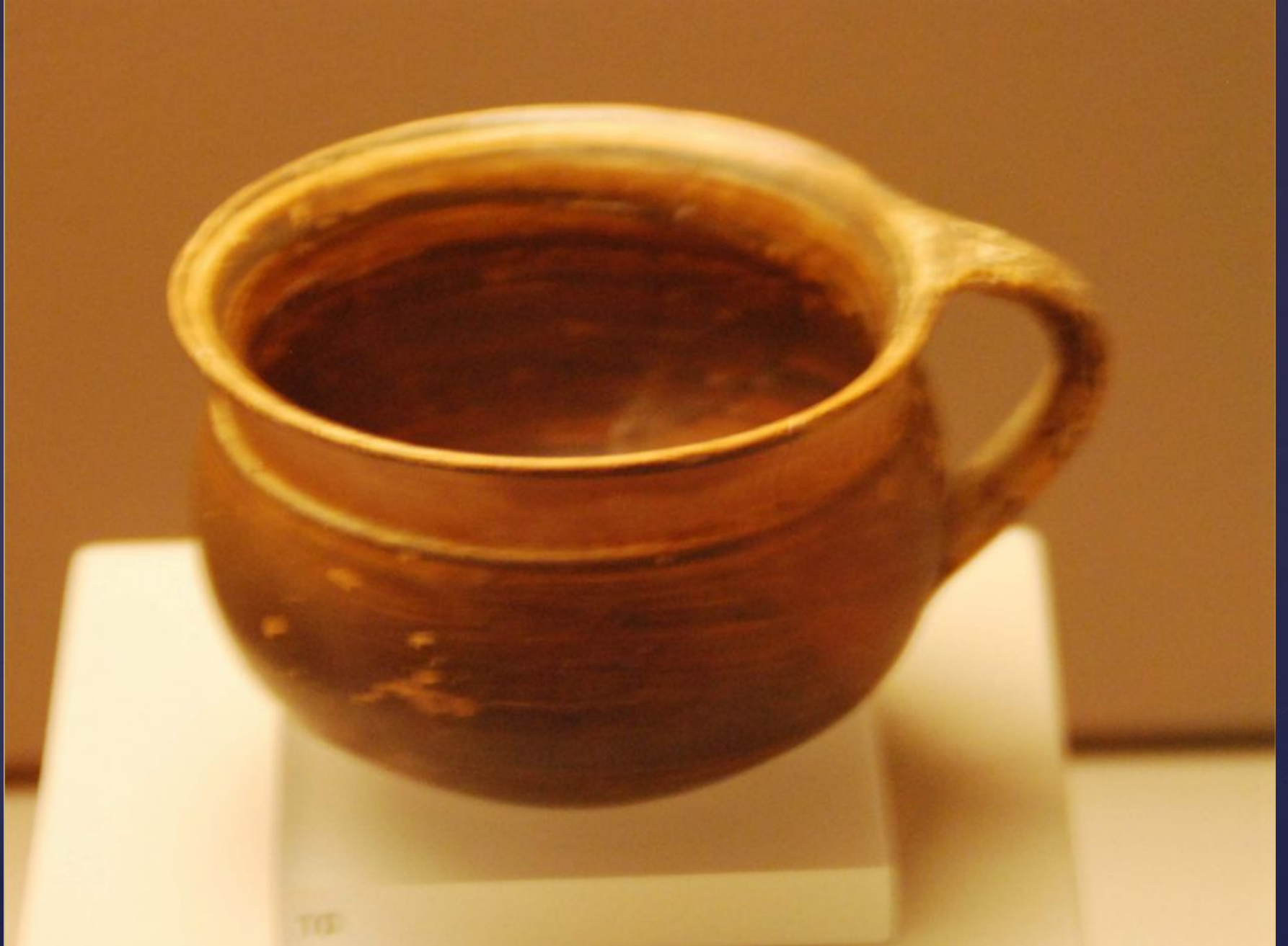
Чаша; 10-м веке до н. э. (поздний Protogeometric); Н. П Гуландрис Сб. 437 в Музее Кикладского искусства в Афинах