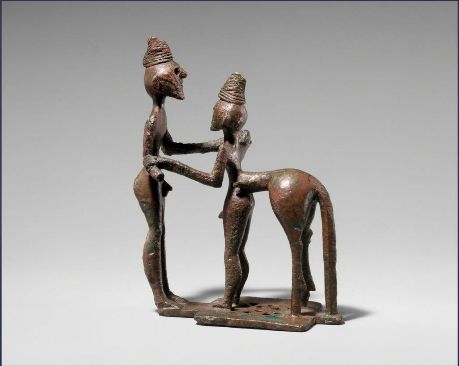
Статуэтка человек и Кентавр, 750 До Н. Э.; Поздний Геометрический/Греческий Бронза; Х. 4 3/8 дюйма. (11.10 см)