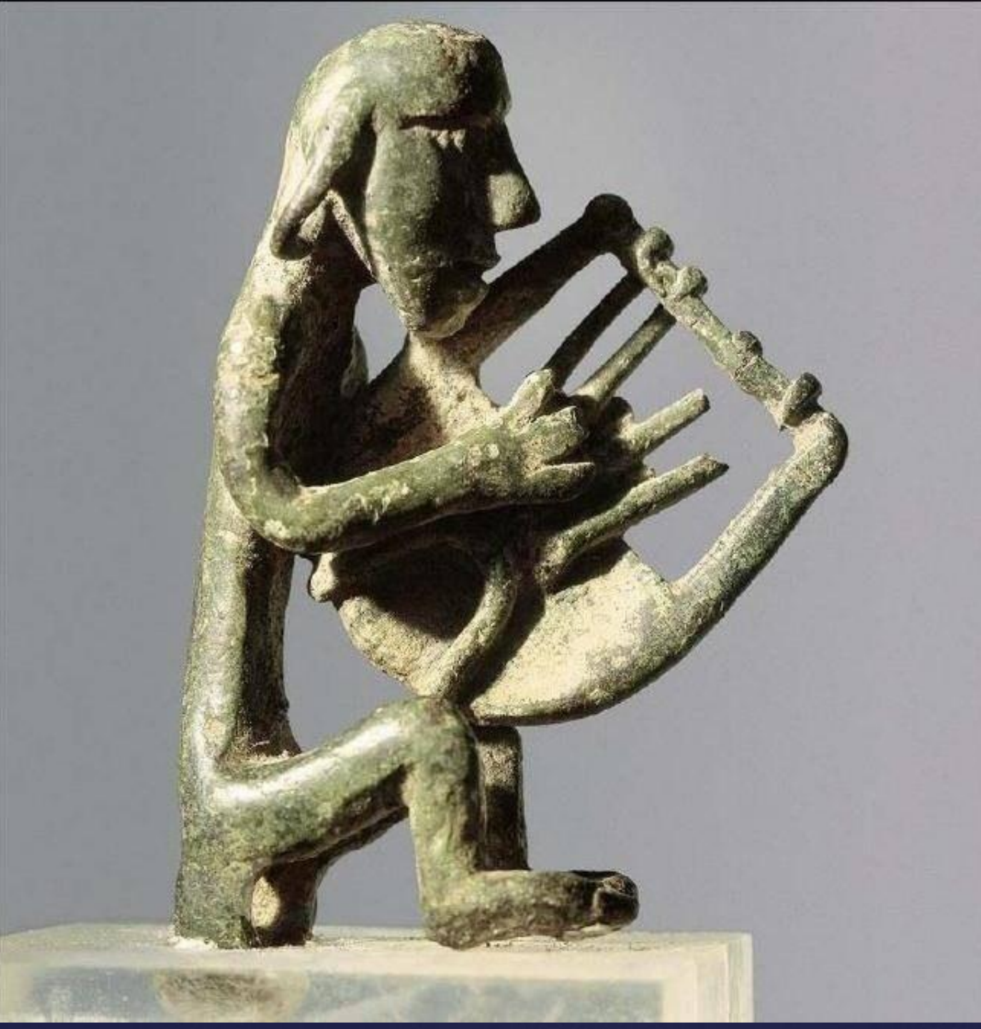
Статуэтка кифареда. Бронза. 3-я четверть VIII в. до н.э