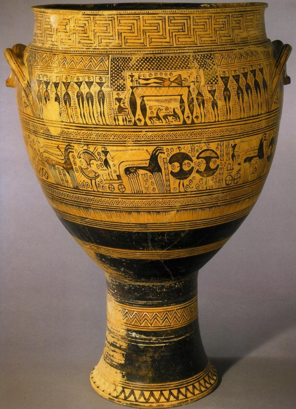
Кратер из Керамика. Экфора. 3-я четверть VIII в. до н.э.