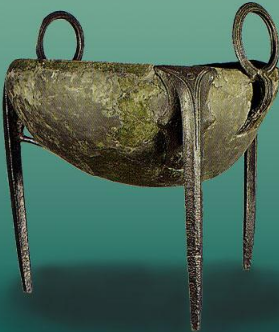
Геометрический треногий котел из Олимпии. VIII в. до н.э. Олимпия, Археологический музей