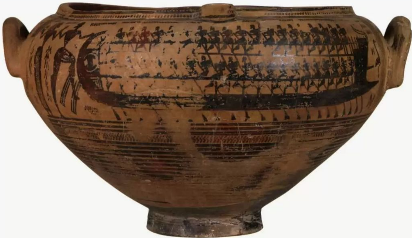
Миска из Фив. Корабль с гребцами. 3-я четверть VIII в. до н.э.