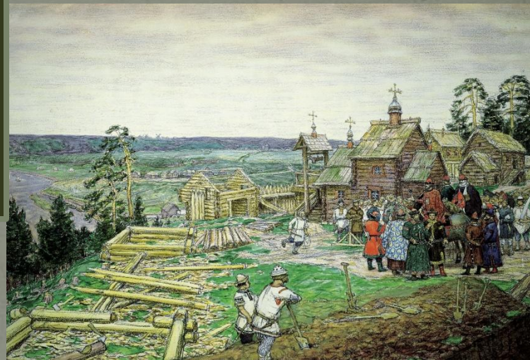
А.Васнецов. Основание Москвы.