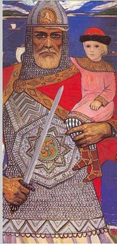
Художник: Глазунов И.

В 882 году князь Олег собрал большое войско и двинулся из Новгорода в поход на Киев. Он подчинил его и сделал столицей, «матерью городов русских».