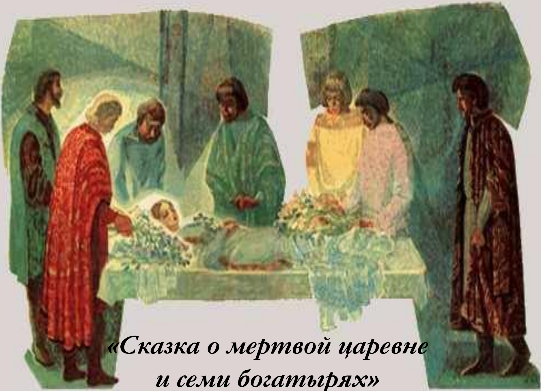
«Сказка о мертвой царевне и семи богатырях»