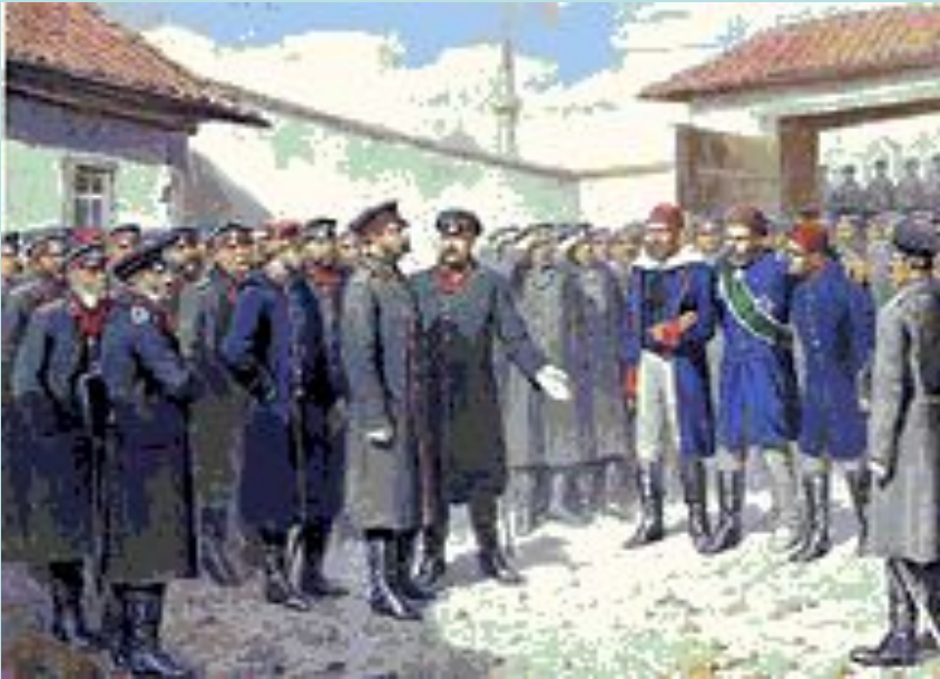
Александр II и Осман Паша