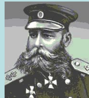
Э.И. Тотлебен М.Д. Скобелев