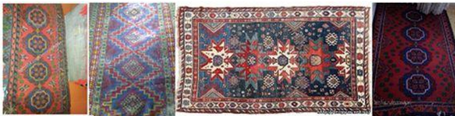
Лезгинские ковры - четырехобъектные (тип А)