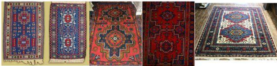
Лезгинские ковры - двухобъектные (тип А)