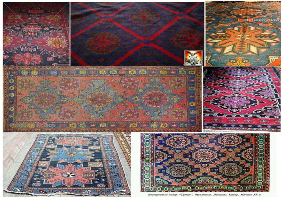
Беззерновой ковер "Сумах", Фрагмент. Лезгиния, Кабар. Начало XX в.

Узор на ковре всегда располагается по центру. Ромбы – их может быть несколько, в зависимости от размера. Обязательная окантовка с узором или без него.