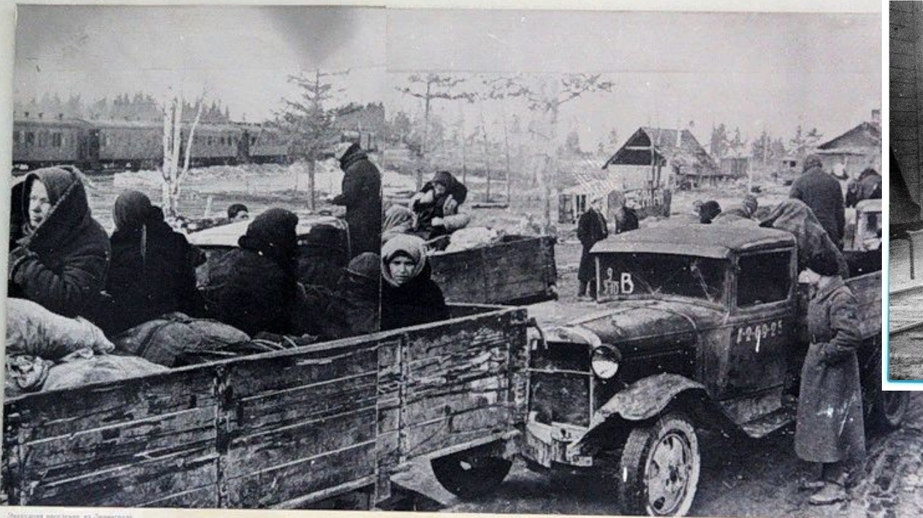
Эвакуируемые выехали из Ленинграда на грузовиках и авто в на "Большую землю".