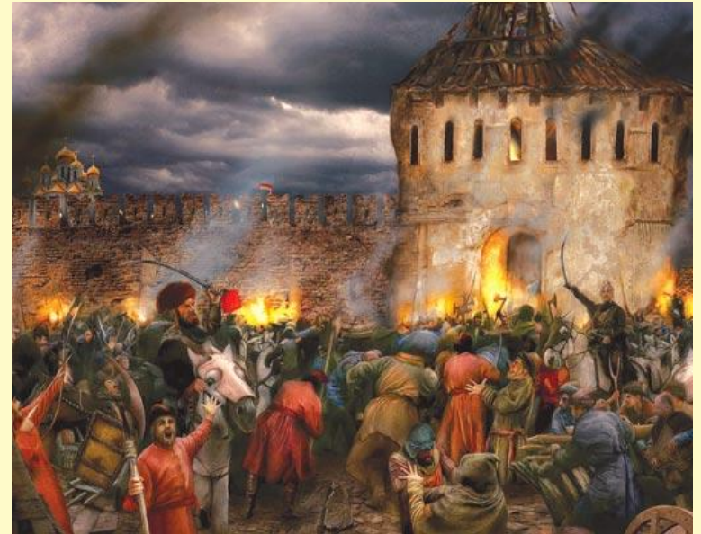
Созыв I ополчения в Рязани.

Центр - г. Рязань. Руководители: П.Ляпунов, князь Д.Трубецкой, казачий атаман И. Заруцкий