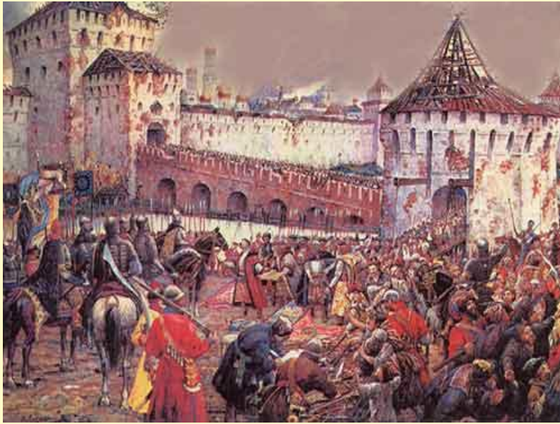
Капитуляция польского гарнизона в Москве

Ополченцы, под предводительством Дмитрия Пожарского, взяли штурмом Китай-город и вынудили поляков отступить в Кремль. Те недолго продержались за крепкими стенами.