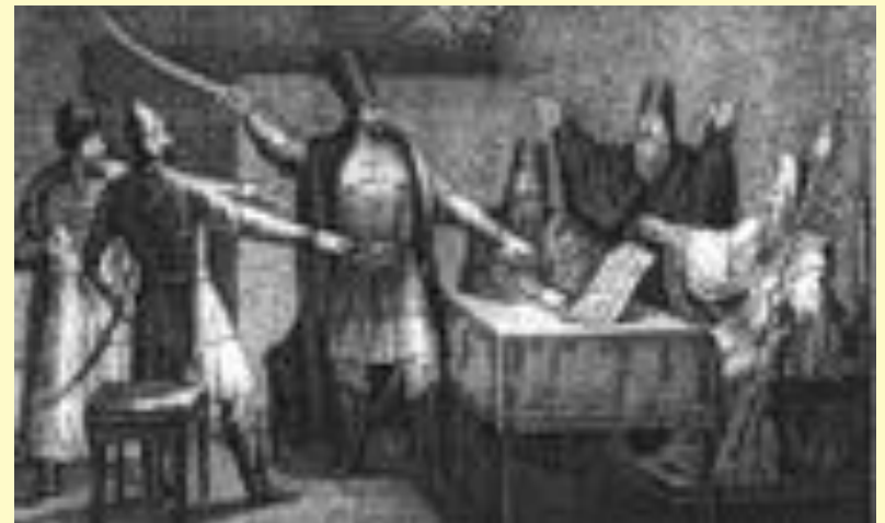
Руководители 1 ополчения