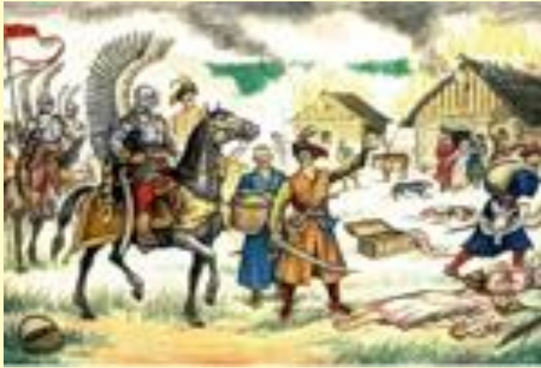
Польские войска в русской деревне