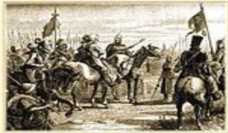
Шведы на пути к Новгороду