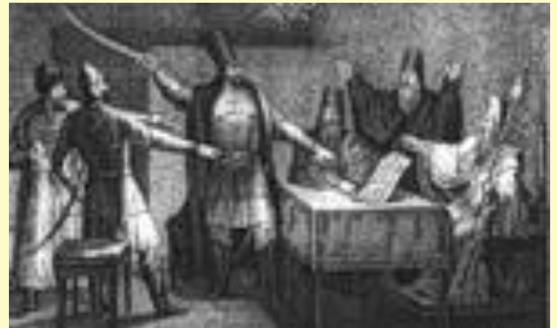
Руководители 1 ополчения