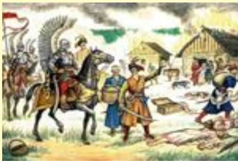
Польские войска в русской деревне