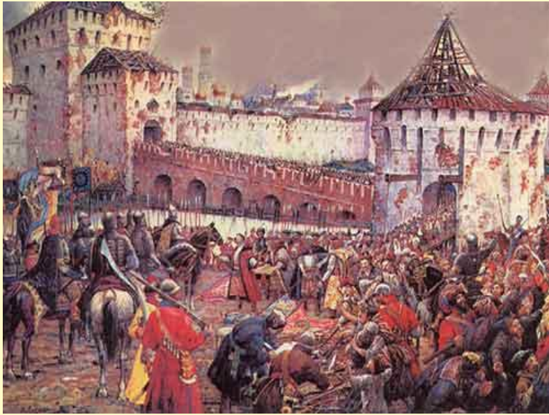
Капитуляция польского гарнизона в Москве

Ополченцы, под предводительством Дмитрия Пожарского, взяли штурмом Китай-город и вынудили поляков отступить в Кремль. Те недолго продержались за крепкими стенами.