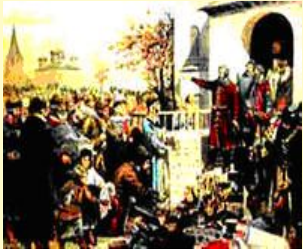
Минин призывает народ к пожертвованию