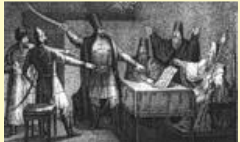
Руководители I ополчения