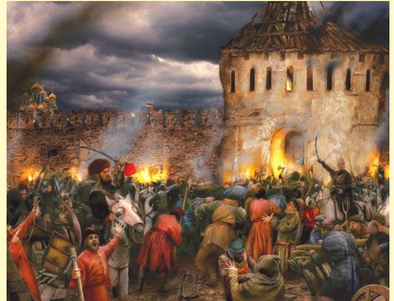
Созыв I ополчения в Рязани.

Центр - г. Рязань. Руководители: П.Ляпунов, князь Д.Трубецкой, казачий атаман И. Заруцкий