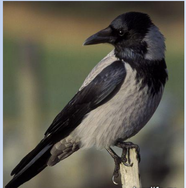
Серая ворона (Corvus cornix)