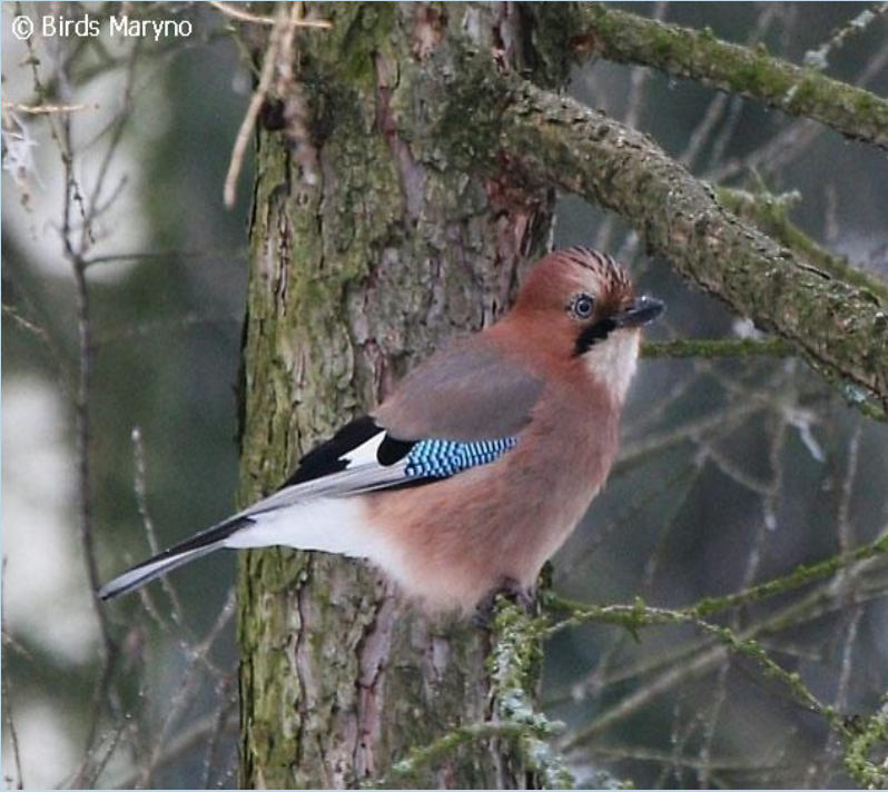
Сойка (Garrulus glandarius L.)