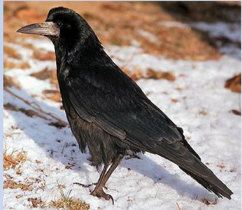
Грач (Corvus corax L.)