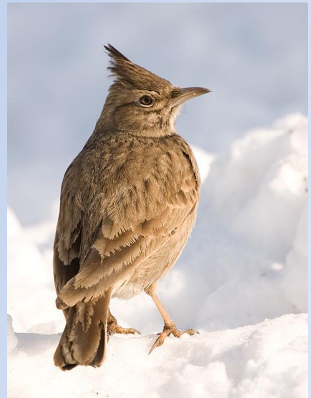
Хохлатый жаворонок ( Galerida cristata L.)