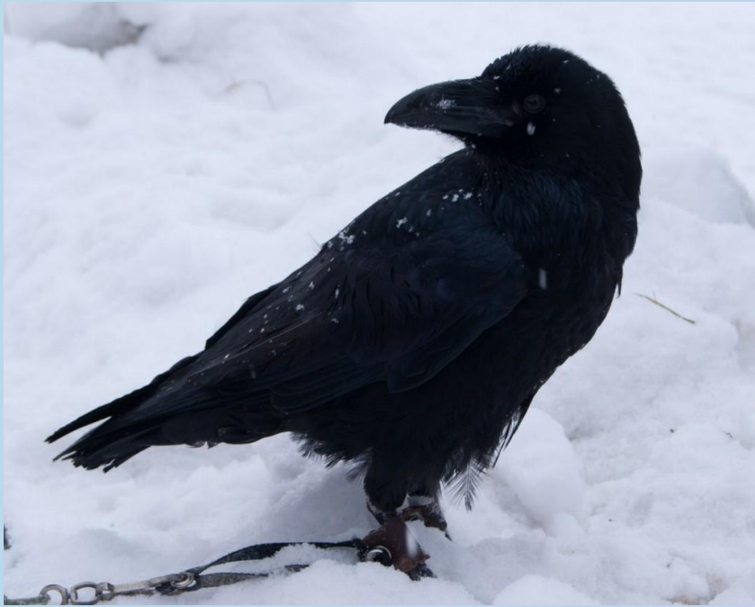
Ворон (Corvus corax)