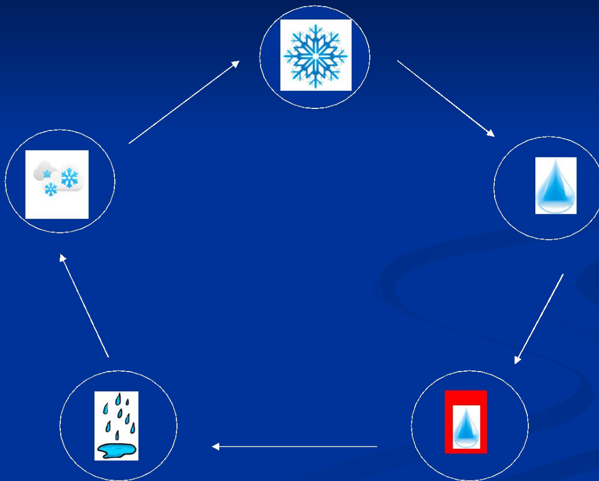
Схема-модель изменения состояния вещества