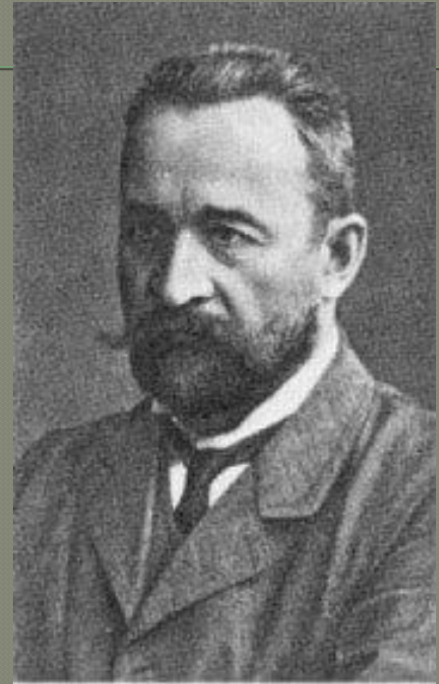
Львов Георгий Евгеньевич - князь, русский политик