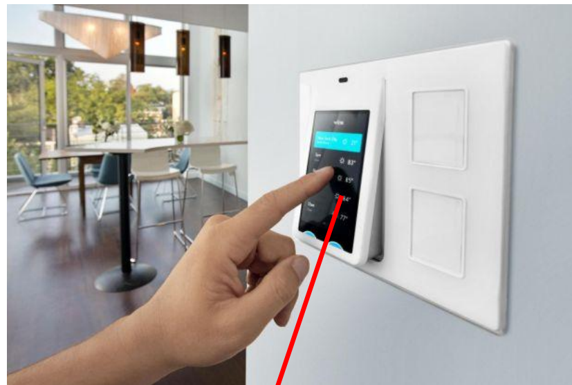
Пульт управления системой поиска