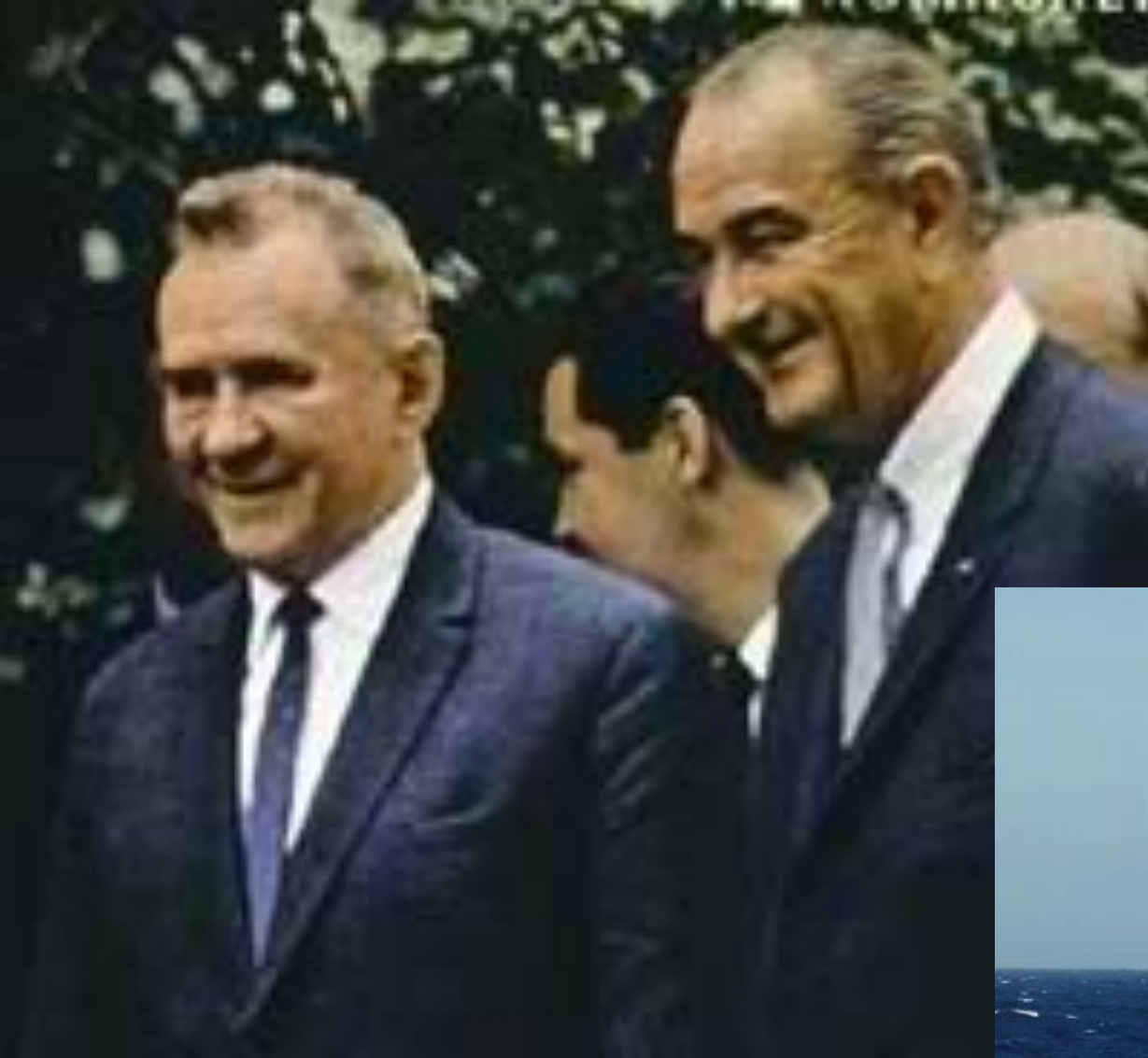
А. Косыгин и Л. Джонсон. Глассборо, 1967г.