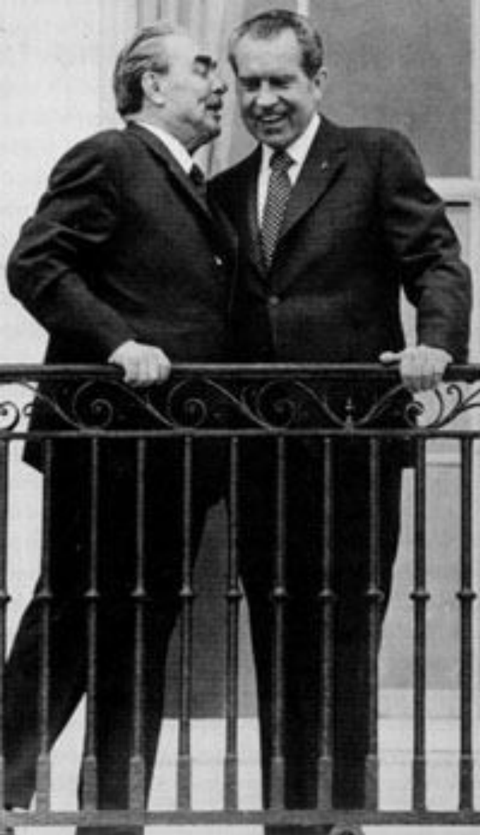
Л.И. Брежнев и Р. Никсон Москва, май 1972г.