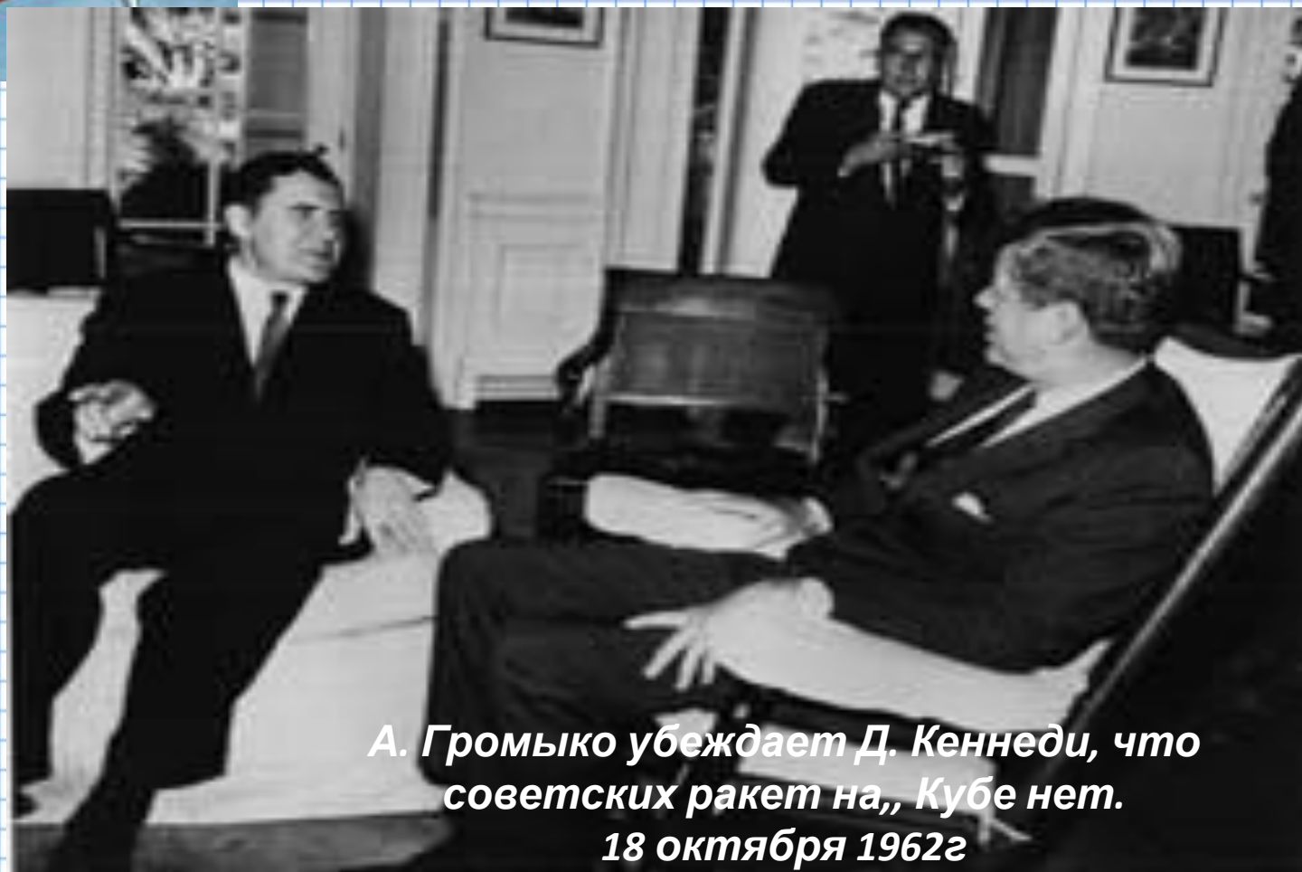
А. Громько убеждает Д. Кеннеди, что советских ракет на,, Кубе нет. 18 октября 1962г

60-е годы - достижение стратегического паритета сверхдержав