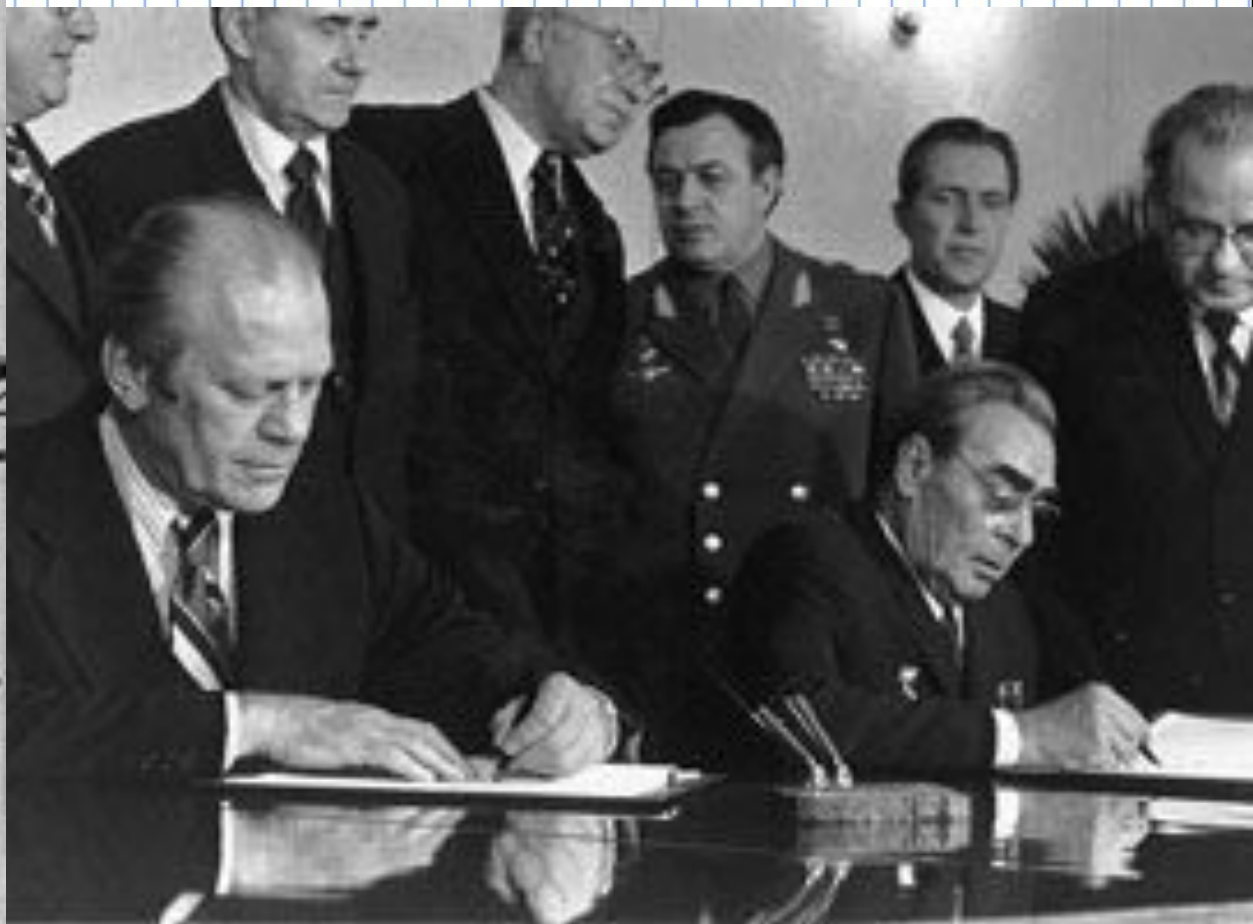
Л. И. Брежнев и президент США Джеральд Форд подписывают договор ОСВ, 24 ноября 1974, Владивосток.