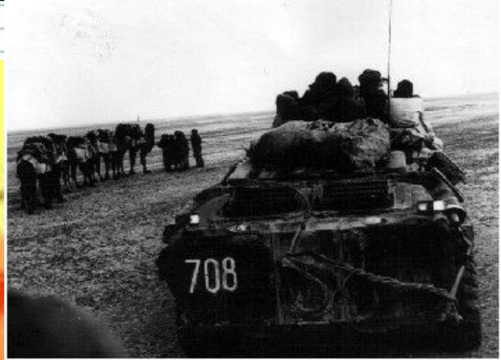
"Красный шторм поднимается" - кошмар Запада второй половины 20 века