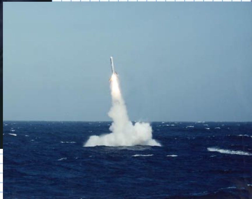
Запуск ракеты с подводной