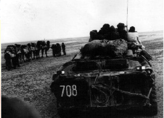
"Красный шторм поднимается" - кошмар Запада второй половины 20 века