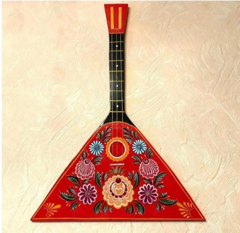
Рисунок 1 – объёмный предмет с городецкой росписью