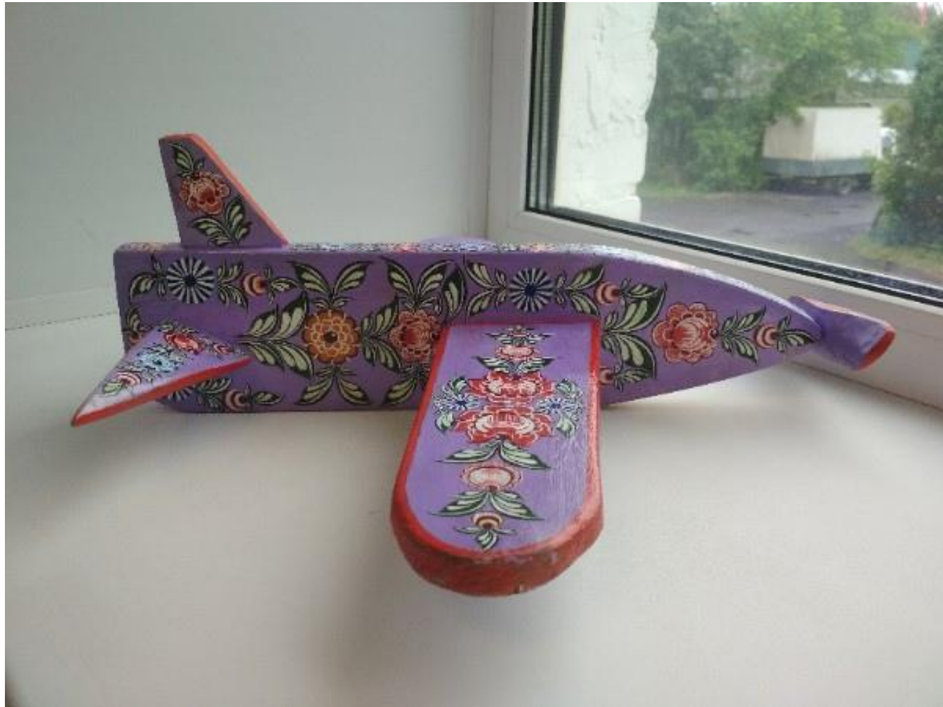
Рисунок 14 – готовый предмет с городецкой росписью