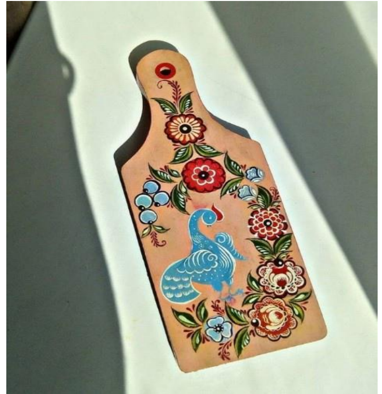
Рисунок 2 – доска с городецкой росписью