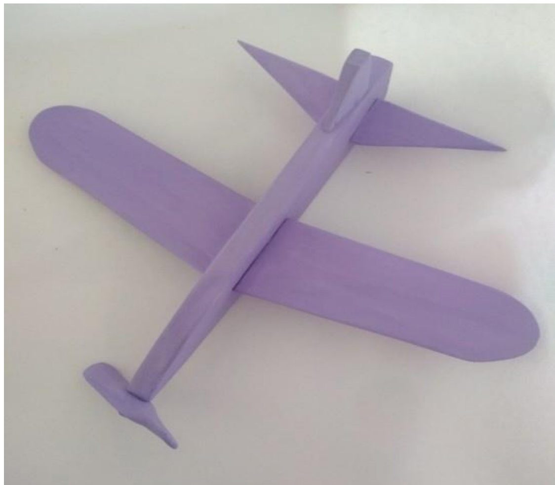
Рисунок 10 – покрытие предмета фоном