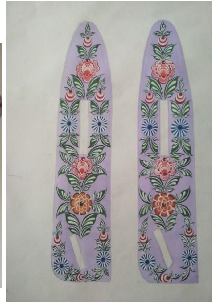
Рисунок 6 – эскиз к игрушечному самолёту