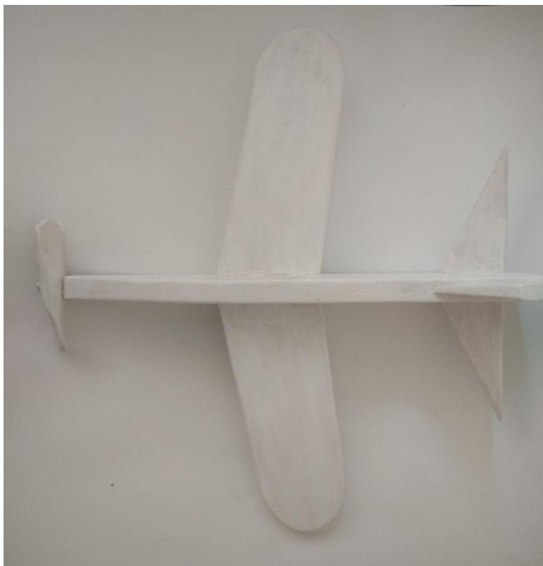
Рисунок 8 – грунтовка предмета на 1 слой