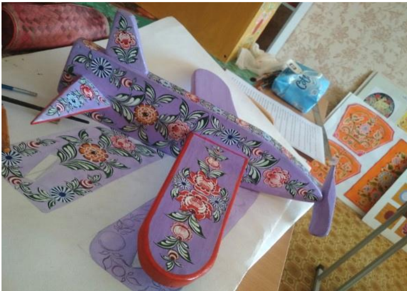
Рисунок 13 – нанесение разживки