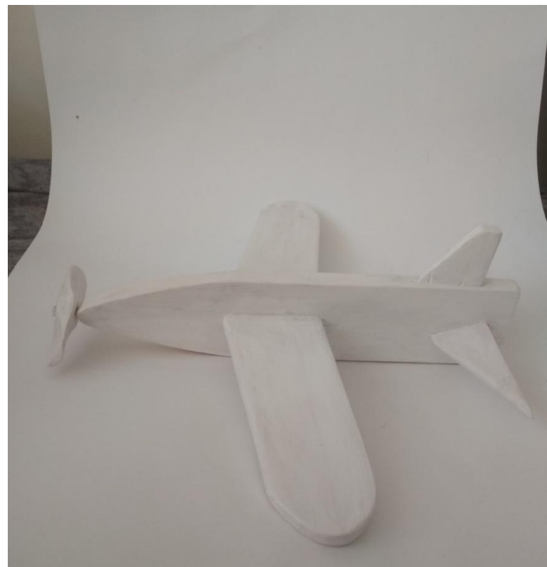
Рисунок 9 – грунтовка предмета на 2 слой