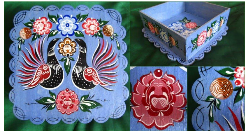
Рисунок 4 – объёмный предмет с городецкой росписью