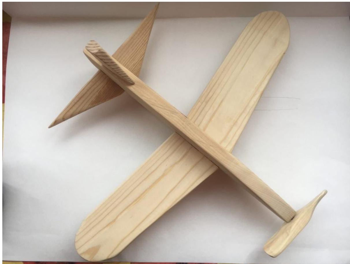
Рисунок 7 – шкурение предмета