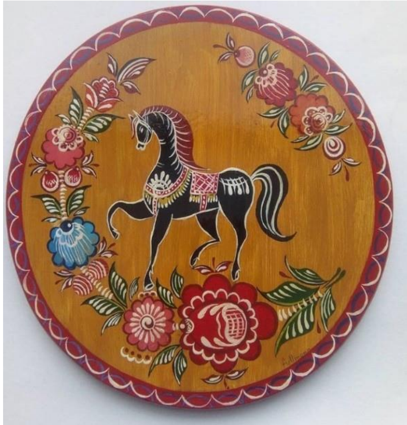
Рисунок 3 – доска с городецкой росписью