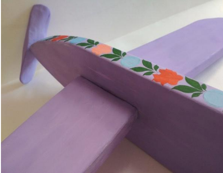
Рисунок 11 – нанесение подмалевка