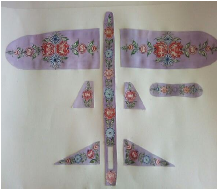
Рисунок 5 – эскиз к игрушечному самолёту