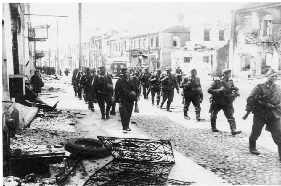
Немецкие солдаты проходят по улице белорусского города Гродно, захваченного в ночь с 22 на 23 июня 1941 г.