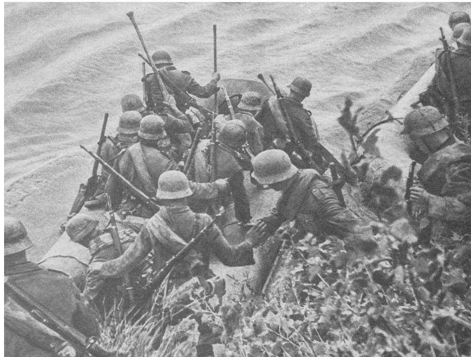
Немецкие солдаты пересекают государственную границу СССР