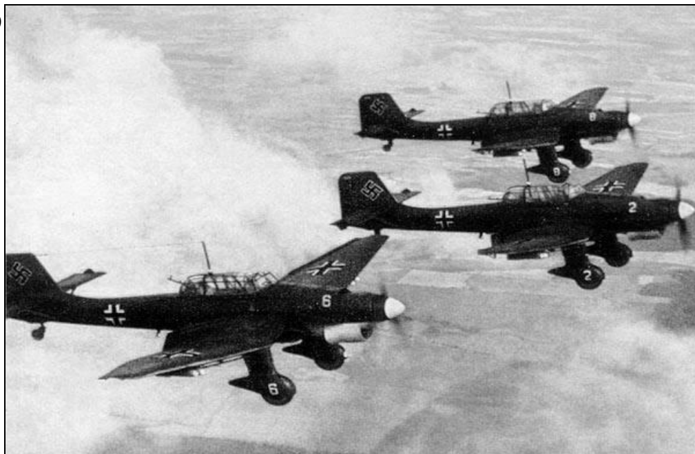
Налёт немецкой авиации