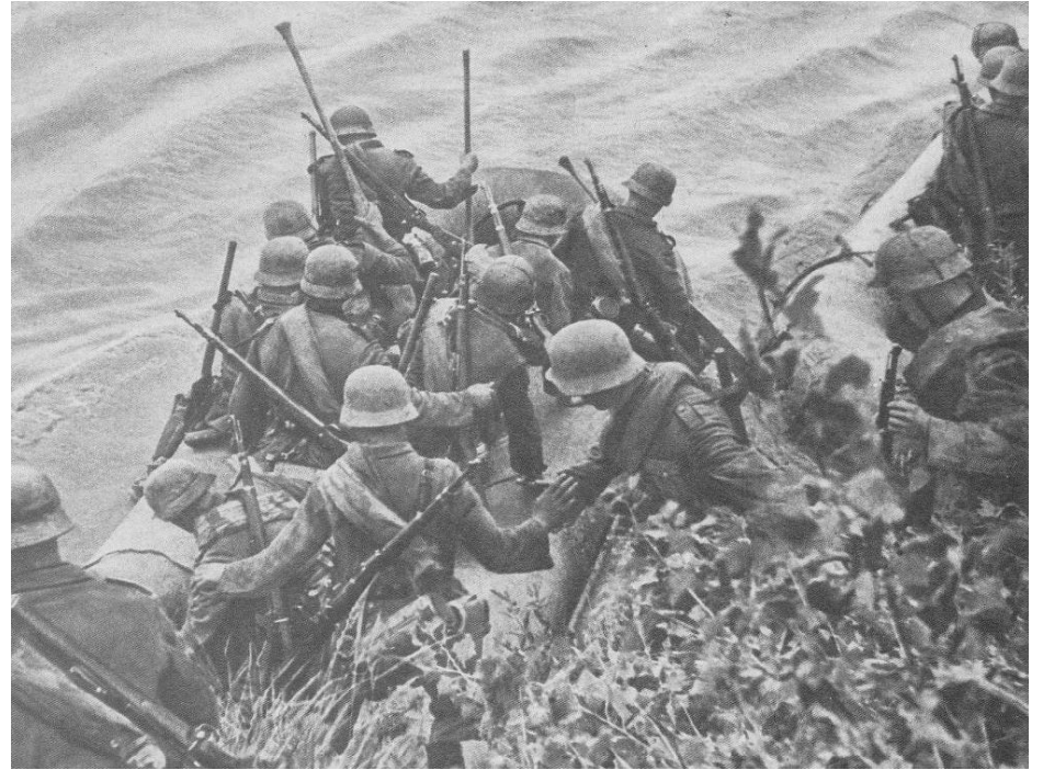
Немецкие солдаты пересекают государственную границу СССР