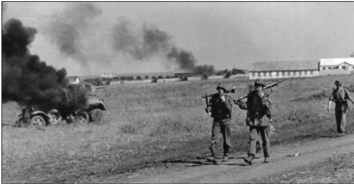
Снимок сделан 24.06.1941г.

Немецкие солдаты рядом с горящей советской деревней. Время съемки июнь 1941