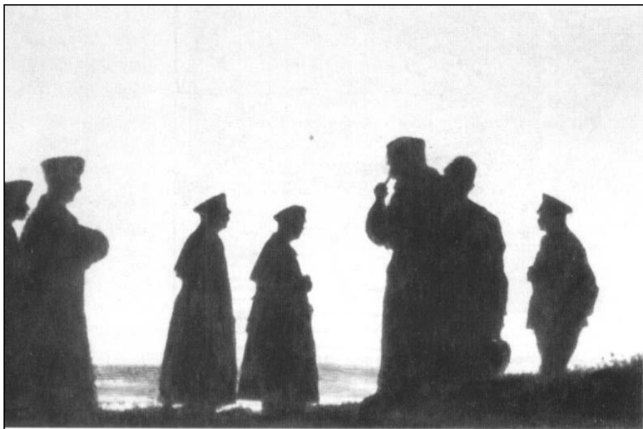
Немецкие генералы за 15 мин до нападения на СССР