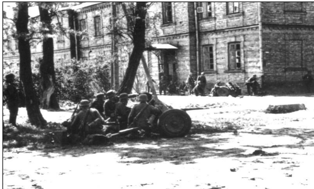
Бой немецких ударных частей в районе Бреста