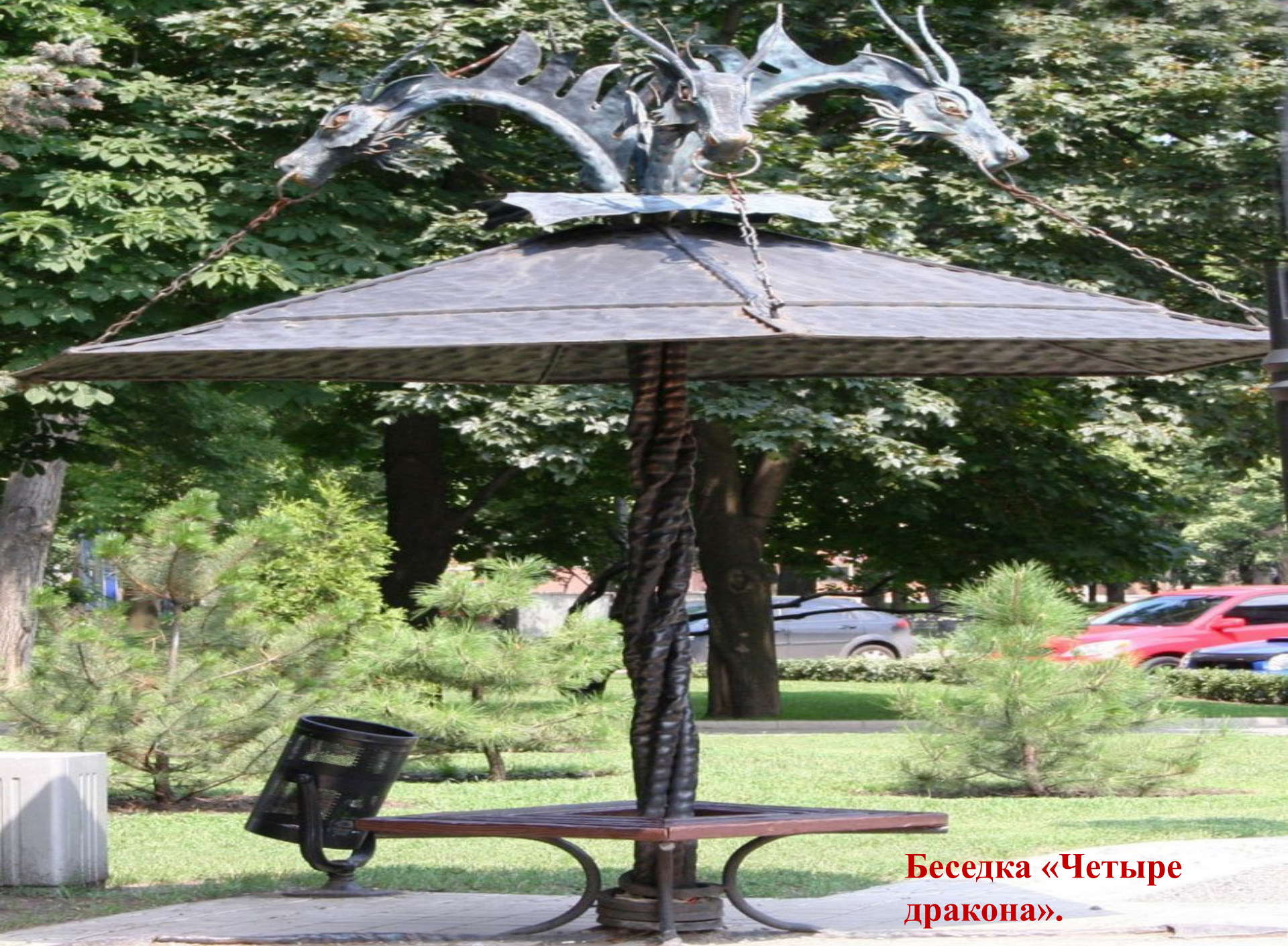
Беседка «Четыре дракона».