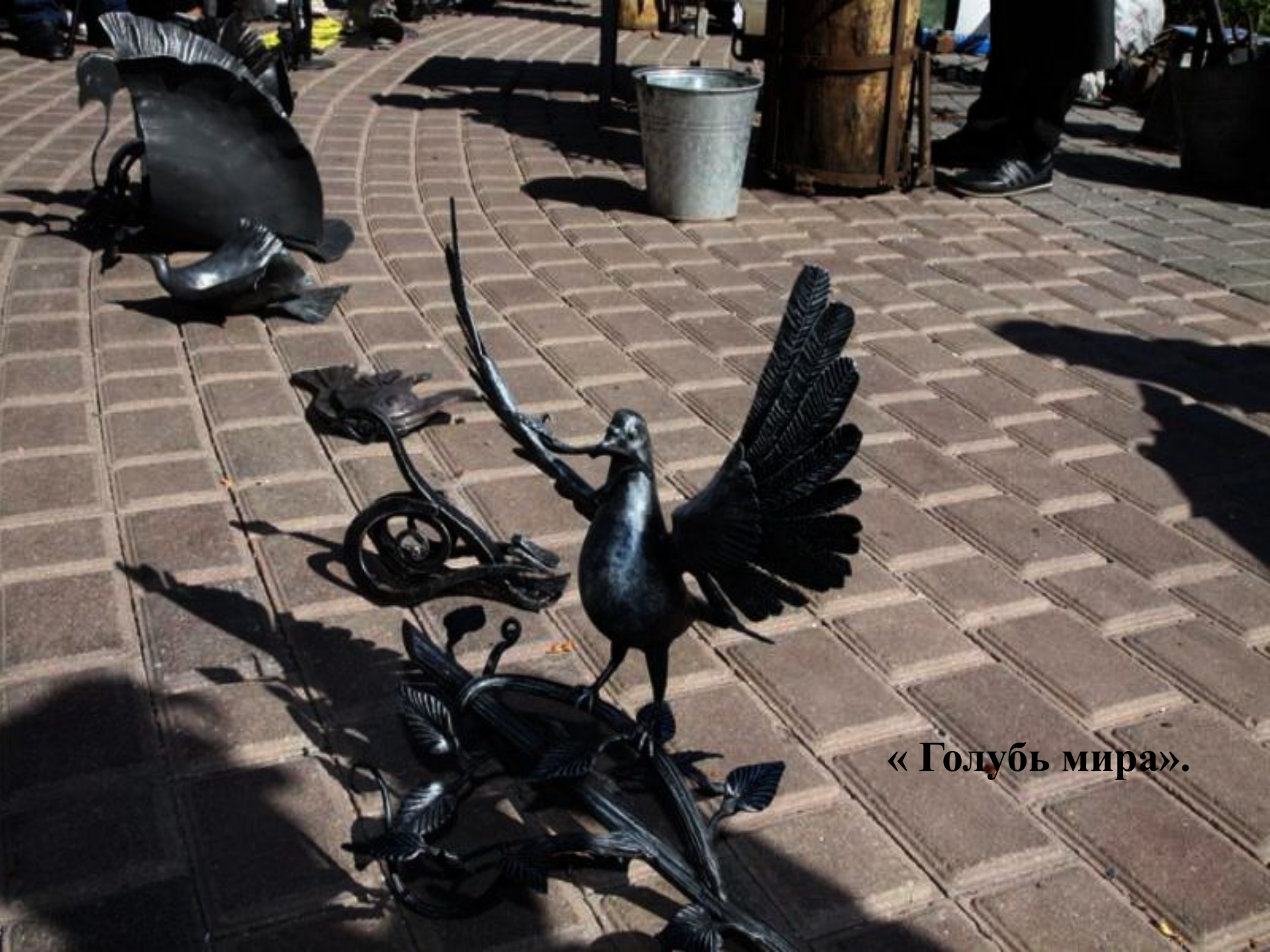
« Голубь мира».