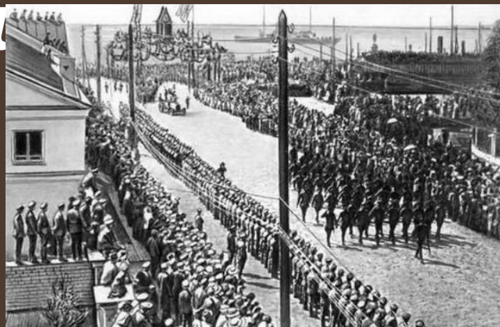
Английские войска в