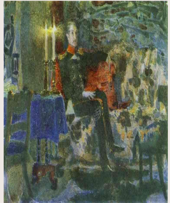
М.Врубель « Печорин на диване»

Пробегаю в памяти все мое прошедшее и спрашиваю себя невольно: зачем я жил? для какой цели я родился?.. А, верно, она существовала, и, верно, было мне назначение высокое, потому что я чувствую в душе моей силы необъятные... Но я не угадал этого назначения, я увлекся приманками страстей пустых и неблагодарных; из горнила их я вышел тверд и холоден, как железо, но утратил навеки пыл благородных стремлений — лучший свет жизни. И с той поры сколько раз уже я играл роль топора в руках судьбы! Как орудие казни, я упал на голову обреченных жертв, часто без злобы, всегда без сожаления... Моя любовь никому не принесла счастья, потому что я ничем не жертвовал для тех, кого любил: я любил для себя, для собственного удовольствия: я только удовлетворял странную потребность сердца, с жадностью поглощая их чувства, их радости и страданья — и никогда не мог насытиться.