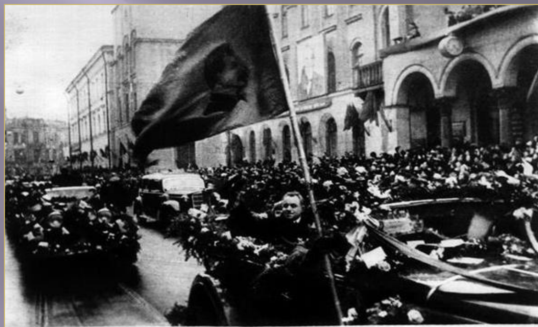
Москвичи восторженно приветствуют жителей Северного полюса.