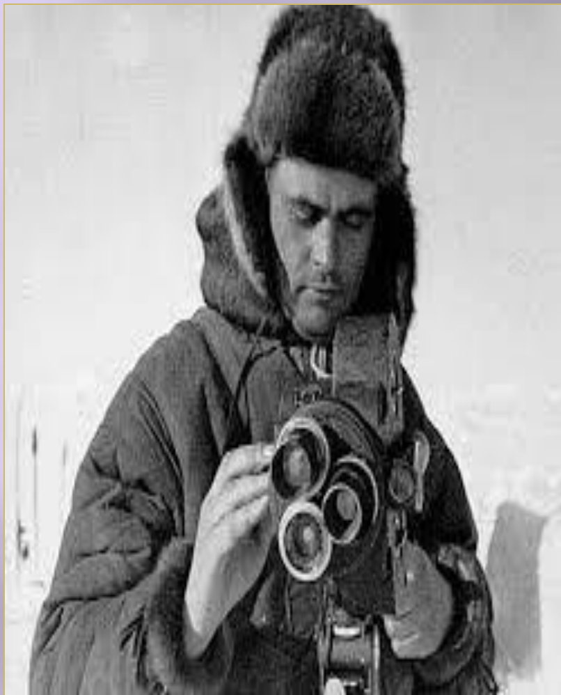
ПЁТР ПЕТРОВИЧ ШИРШОВ ГИДРОБИОЛОГ ,ОКЕАНОГРАФ, ВРАЧ