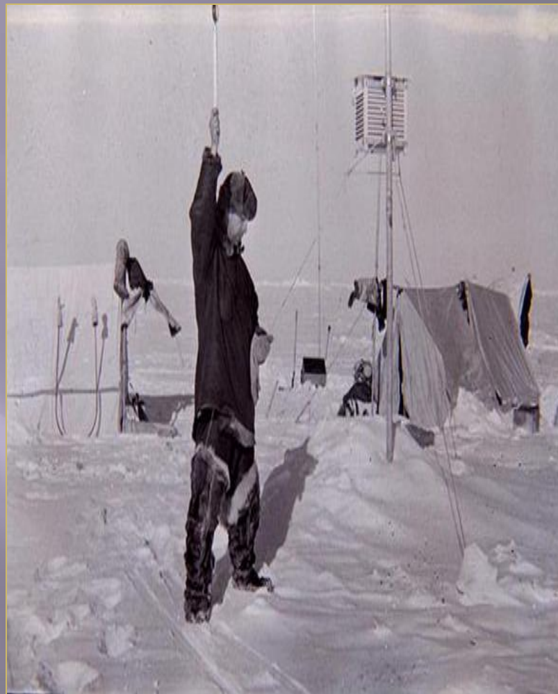
ЕВГЕНИЙ КОНСТАНТИНОВИЧ ФЁДОРОВ МЕТЕОРОЛОГ, ГЕОФИЗИК