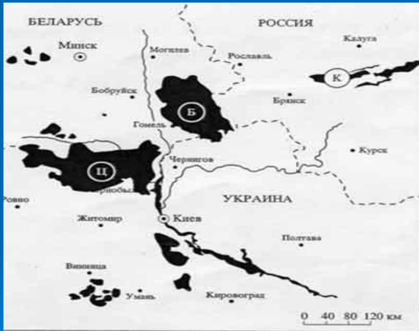
Рис. 1. Основные очаги радиоактивного загрязнения Европейской части СССР