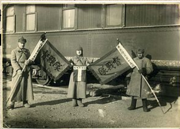
Бойцы РККА с захваченными гоминьдановскими знамёнами Чжан Сюэляна (штаба 15-й бригады Северо-Восточной армии)