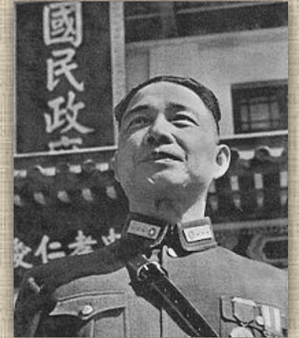
Ван Цзинвэй в форме генерала особого класса

«Нанкинское» десятилетие гоминьдановского