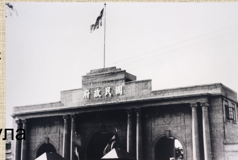
Центральное правительство в Нанкине, 1927 год