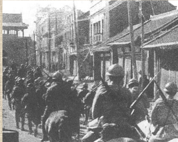
Японские войска входят в Мукден

Вторжение японских войск в Маньчжурию принципиально изменило политическую ситуацию, резко усилив тенденции к политическому и военному единству.