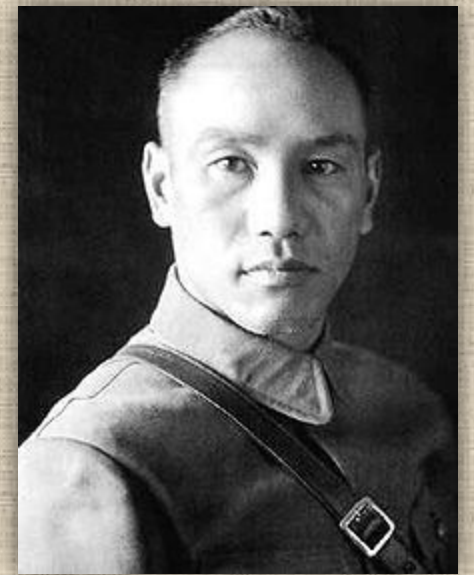
Чан Кайши в 1930-х годах