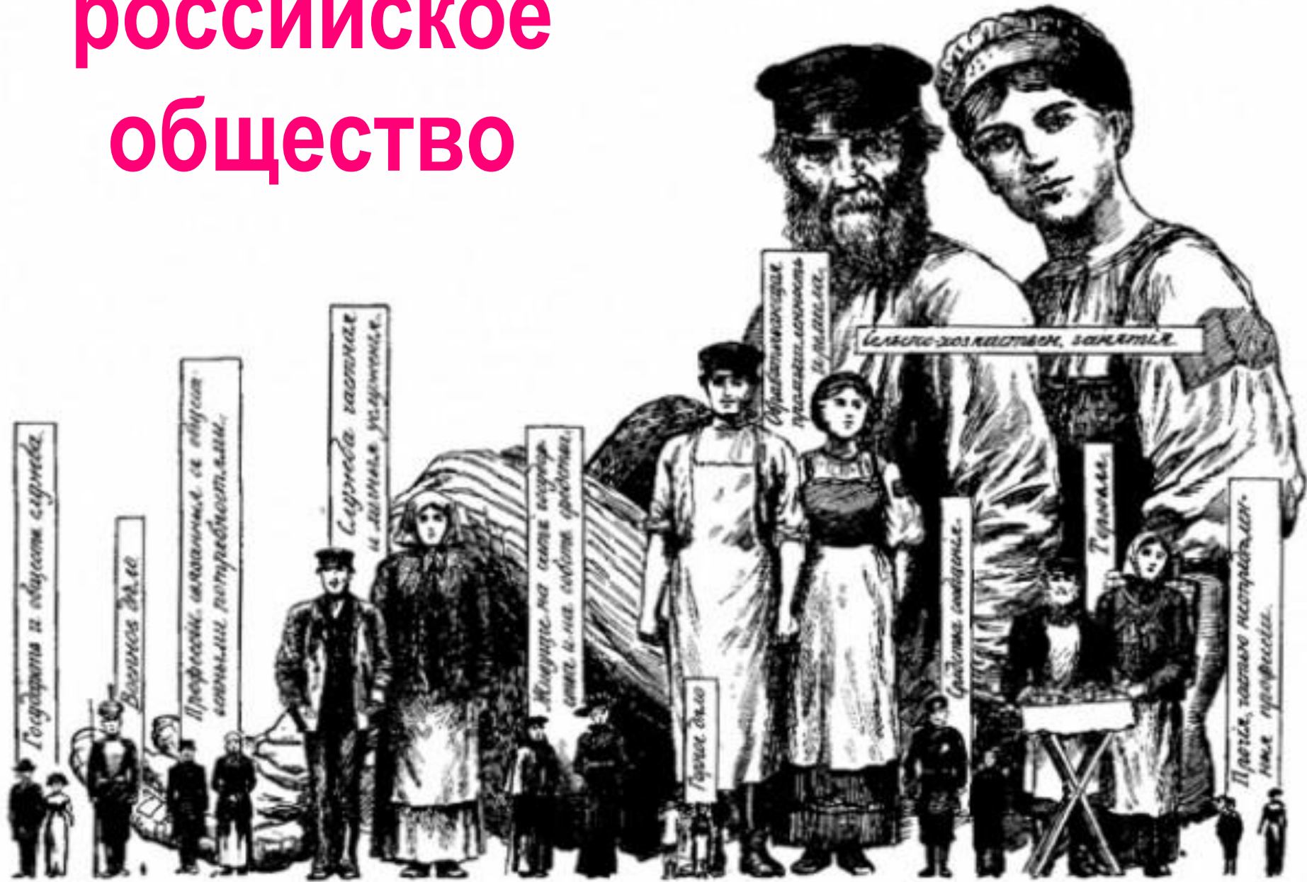
Профессиональный состав россійскаго населенія. Относительная численность профессій.