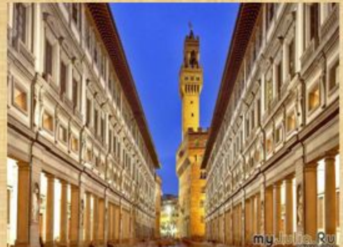
Уффици в Италии