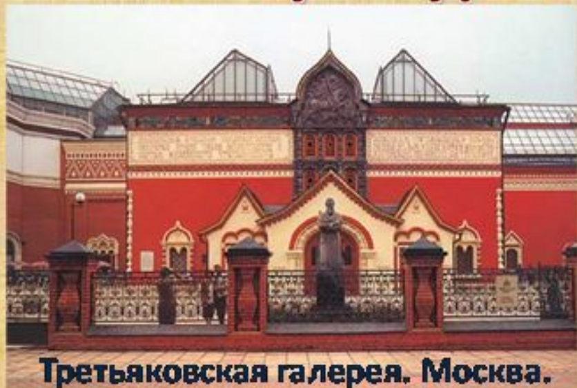
Третьяковская галерея. Москва.