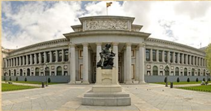
Музей Прадо - главный музей Испании.