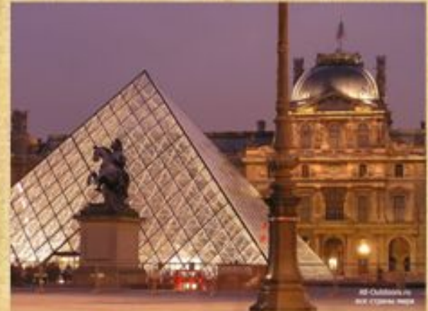
Лувр во Франции