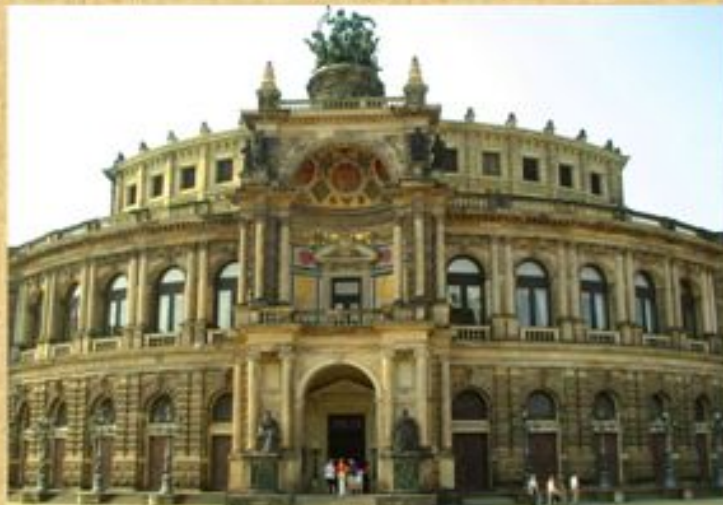
Дрезденская картинная галерея