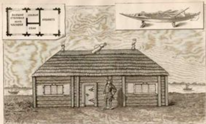
Домик Петра Великого в первоначальном виде.