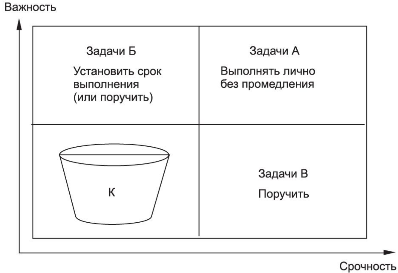
Дуайт Дэвид Эйзенхауэр англ. Dwight D. Eisenhower