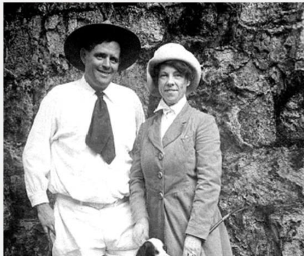
Д. Лондон и Э.Маддерн

В 1905 г. Чармиан и Джек решили официально пожениться. Стоит заметить, что вторая супруга Лондона, так же как и он любила всевозможные путешествия и обладала авантюрным характером.