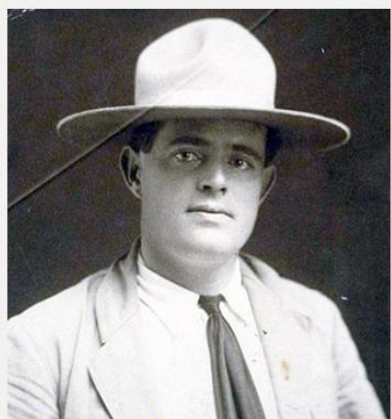
Д. Лондон в юности

Когда в 1873 г. в США начался экономический кризис, семейство Лондонов испытывало серьезные материальные трудности. По воспоминаниям писателя они часто голодали, не имея самых простых для жизни вещей.