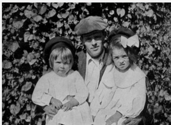
Д. Лондон с дочерьми