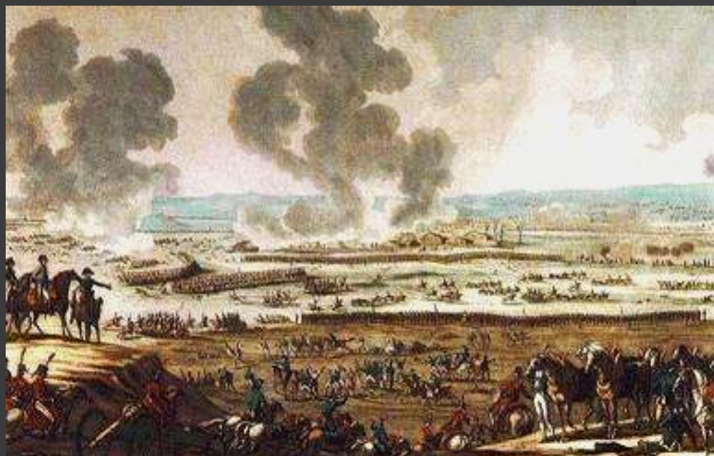
Битва при Аустерлице