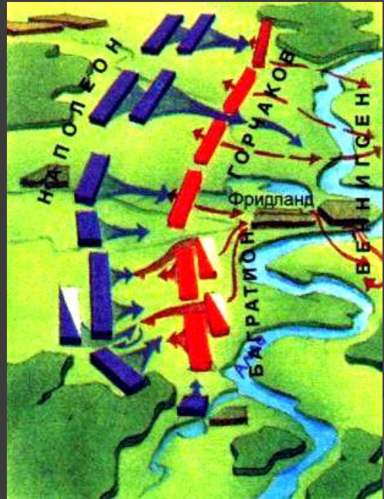
Битва под Фридландом