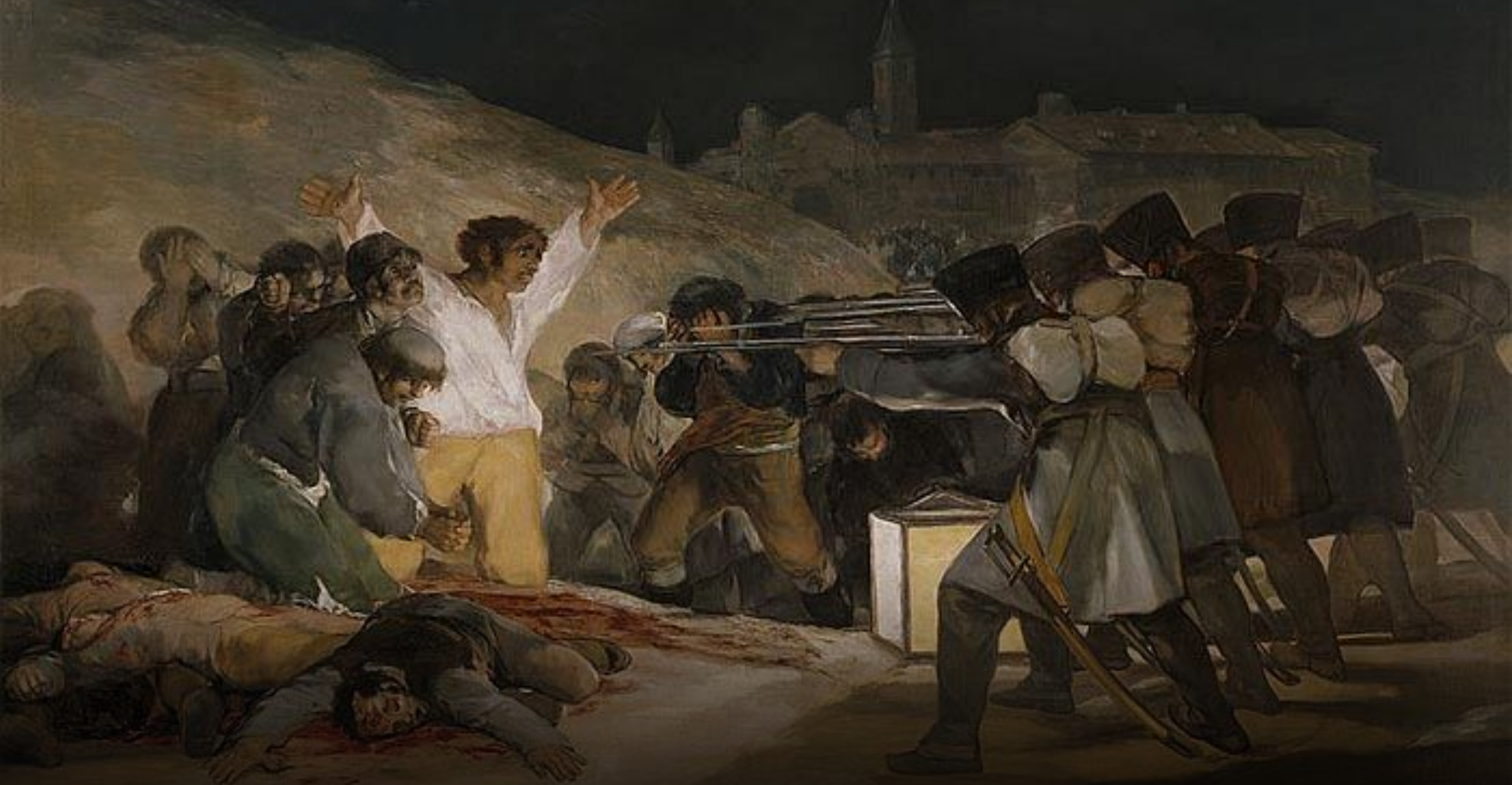
"Расстрел французами мадридских повстанцев 3 мая 1808 г." - картина Ф.Гойи