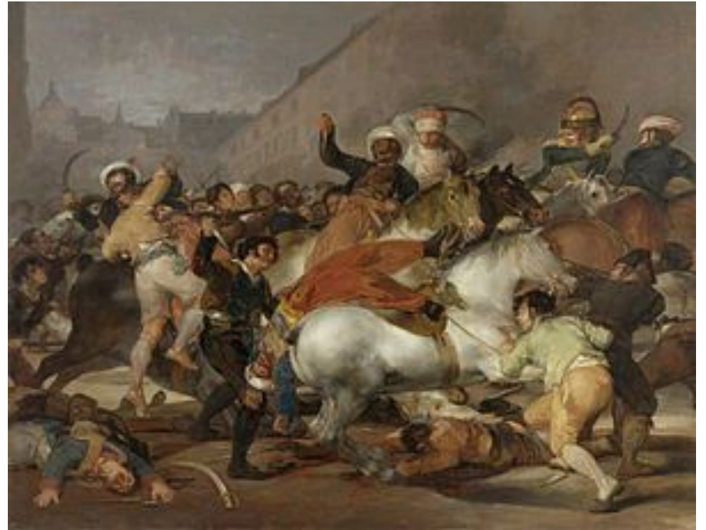
«Восстание 2 мая 1808 года в Мадриде». Франциско Гойя, 1814