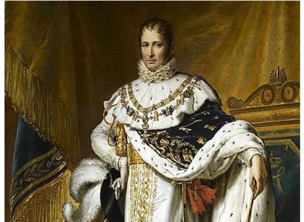
Иосиф I Бонапарт