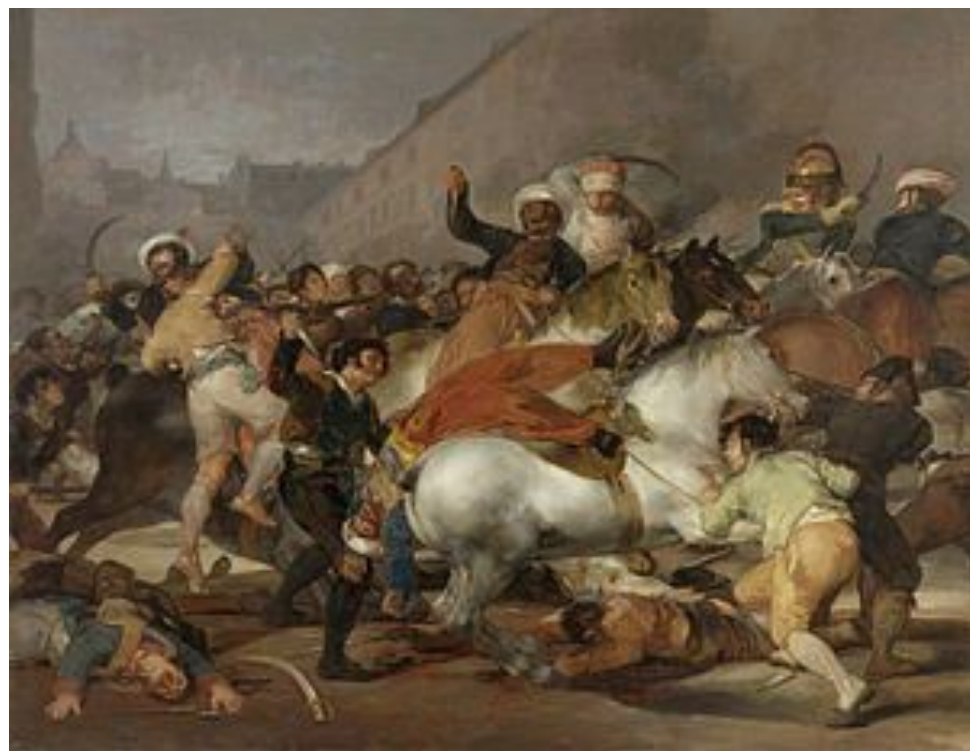
«Восстание 2 мая 1808 года в Мадриде». Франциско Гойя, 1814