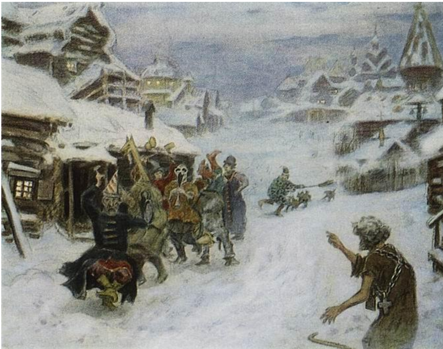
А. П. Васнецов. Скоморохи. 1904.