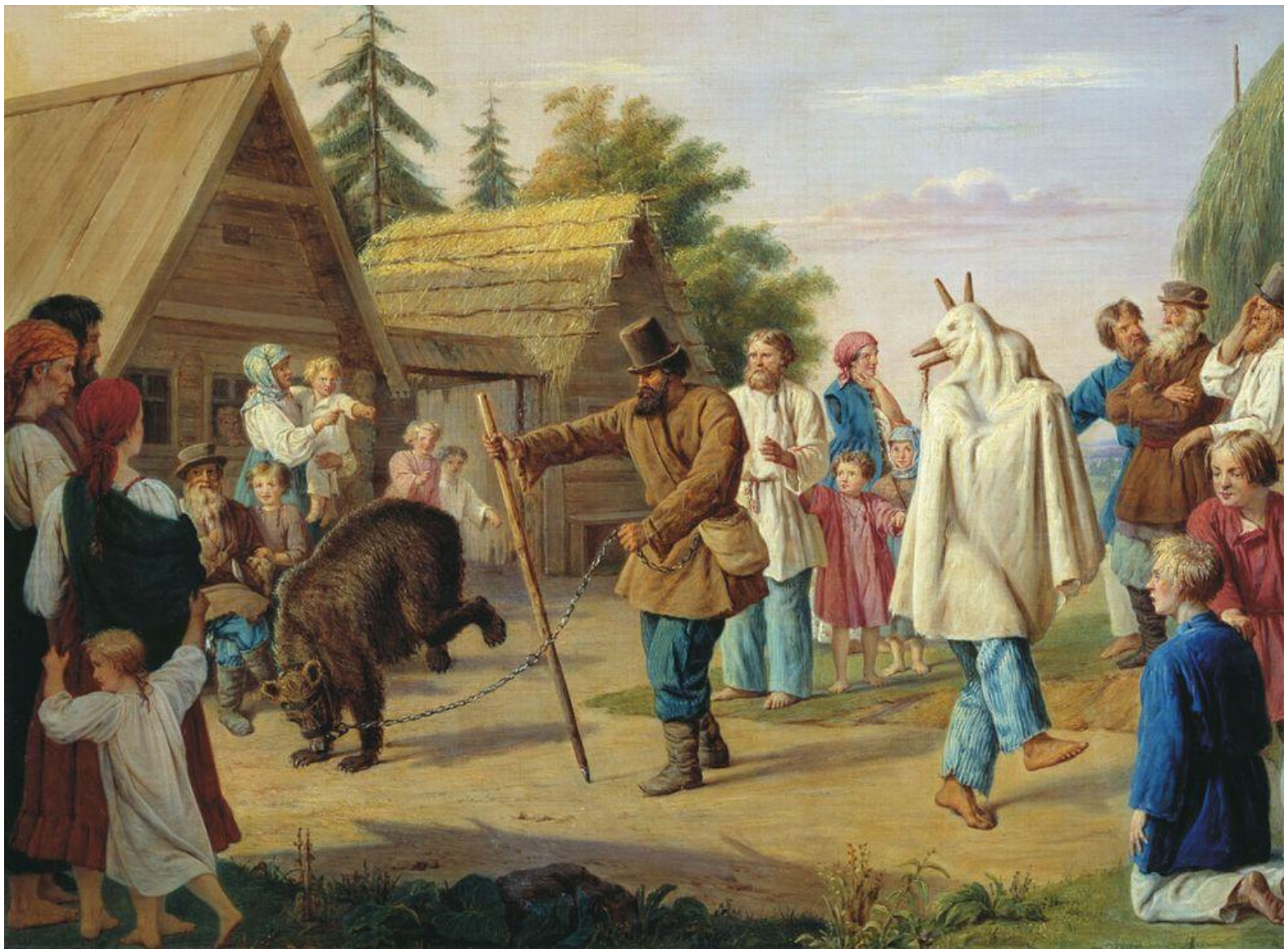
Ф. Н. Рисс. Скоморохи в деревне. 1857