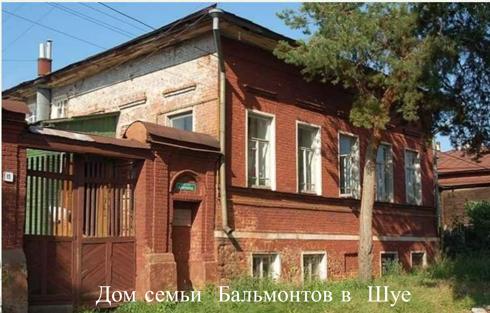
Дом семьи Бальмонтов в Шуе