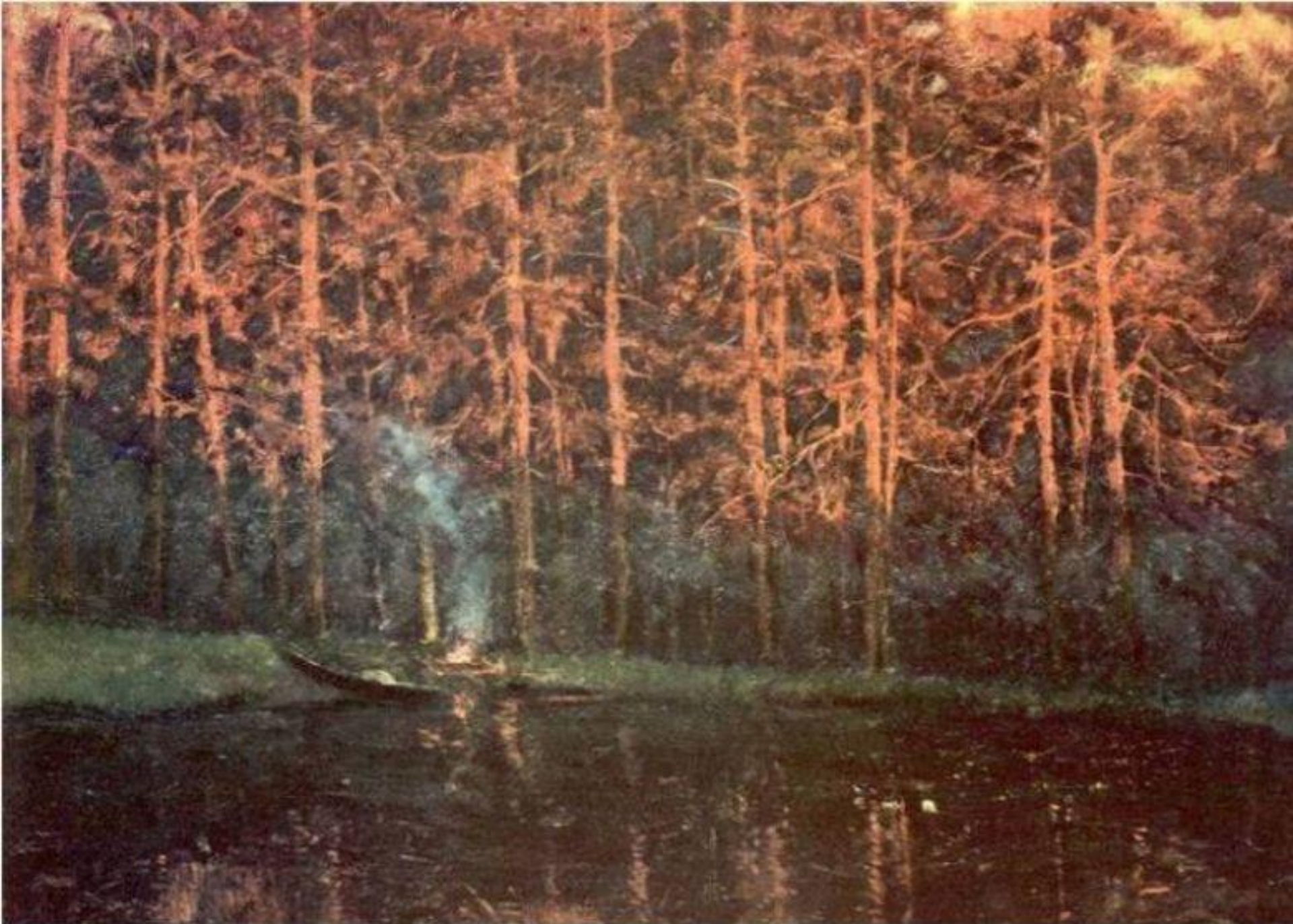
Ромадин. Последний луч. 1945