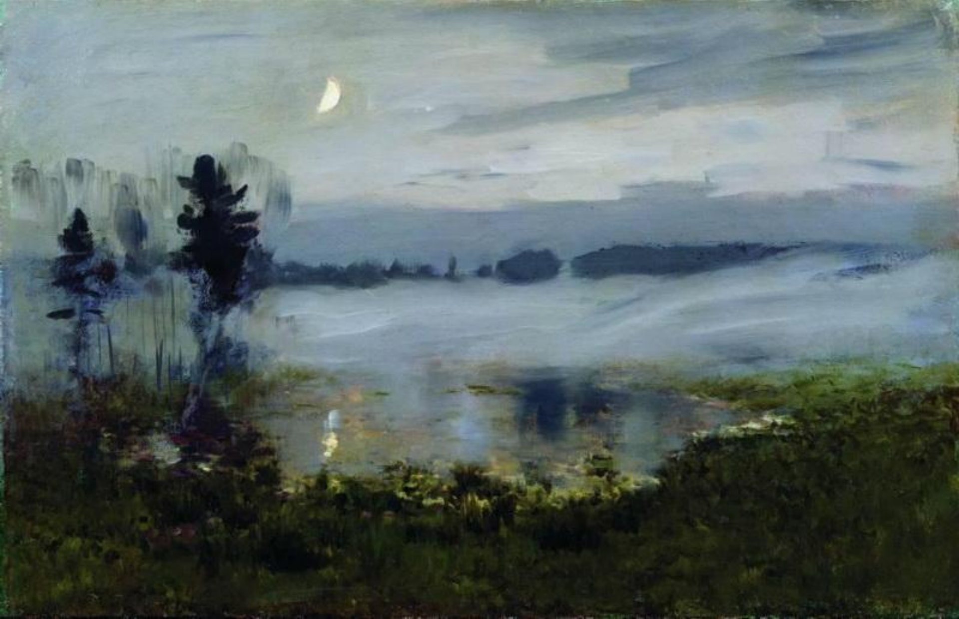
И. Левитан. Туман над водой. 1890-ые